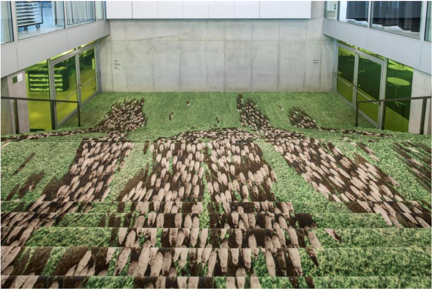
Via Lewandowsky: Treppenläufer, 2007 / © VG Bild-Kunst, Bonn

Kunst am Bau im Auftrag des Bundes seit 1950