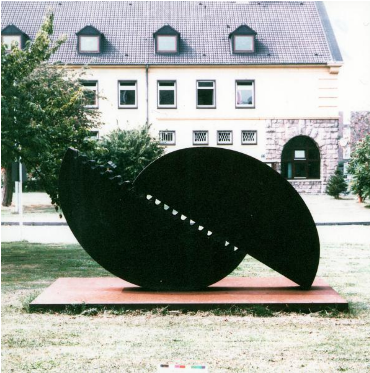
Wolfgang Nestler: Technik und Wissenschaft, 1979 / © Wolfgang Nestler

Kunst am Bau im Auftrag des Bundes seit 1950