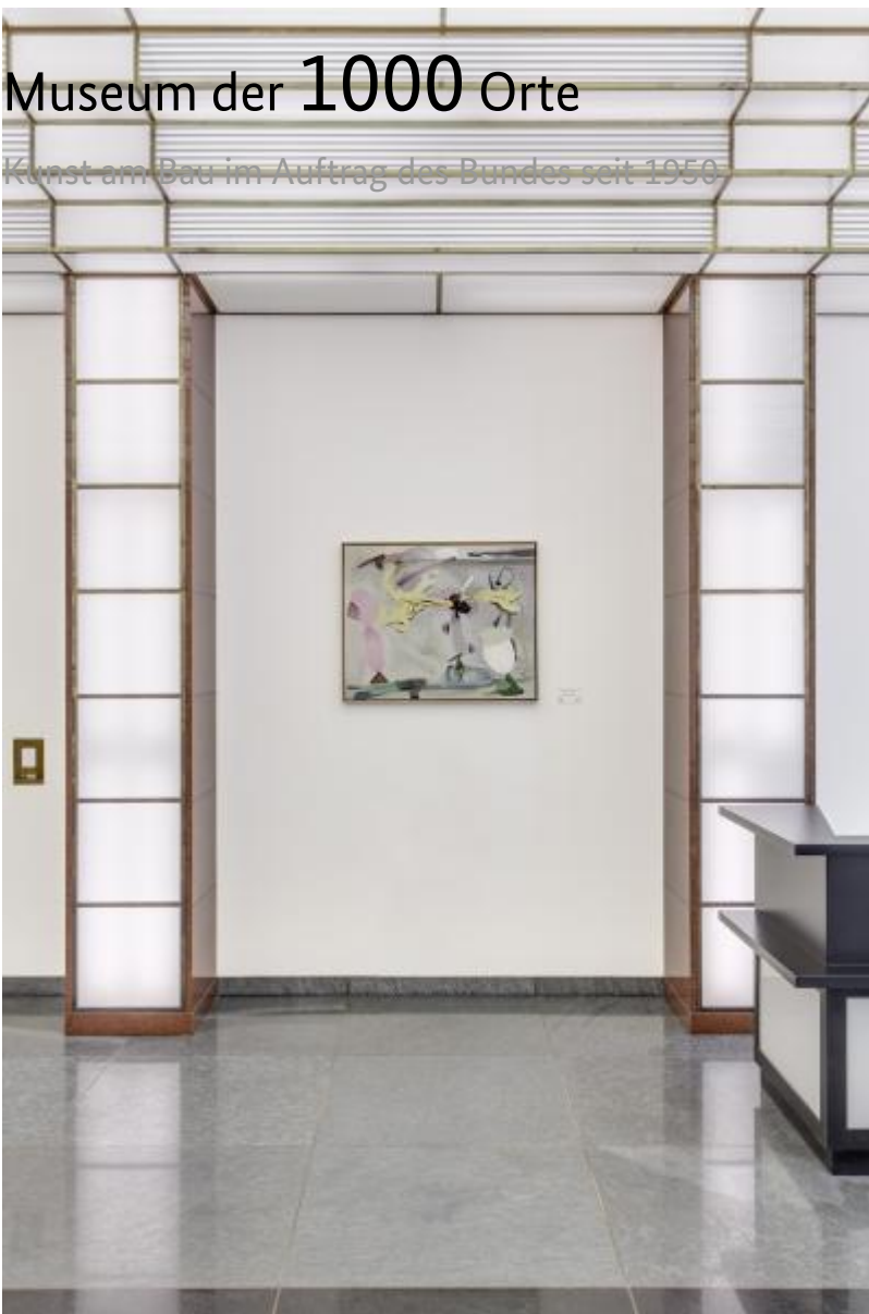
Peter Chevalier: Sternenruhe / Rest eines Traumes / K. im Glassaal, 2000 / © VG Bild-Kunst, Bonn

Kunst am Bau im Auftrag des Bundes seit 1950