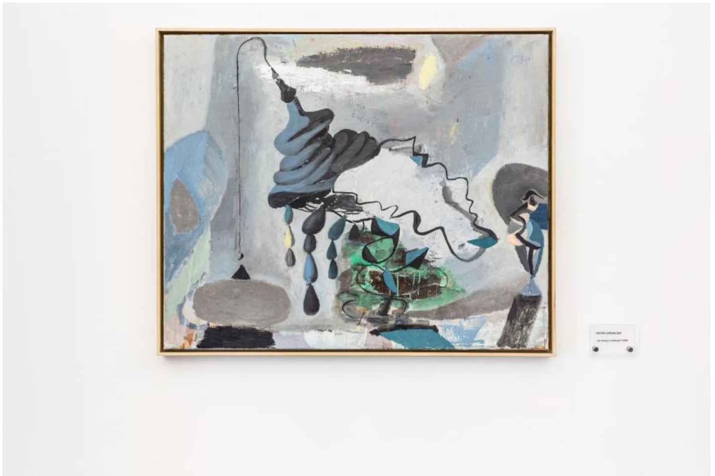
Peter Chevalier: Sternenruhe / Rest eines Traumes / K. im Glassaal, 2000 / © VG Bild-Kunst, Bonn

Kunst am Bau im Auftrag des Bundes seit 1950