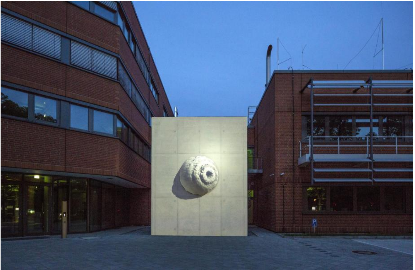
Egill Saebjörnsson: Steinkugel, 2014 / © Egill Saebjörnsson; Fotonachweis: BBR / Cordia Schlegelmilch (2014)

Kunst am Bau im Auftrag des Bundes seit 1950