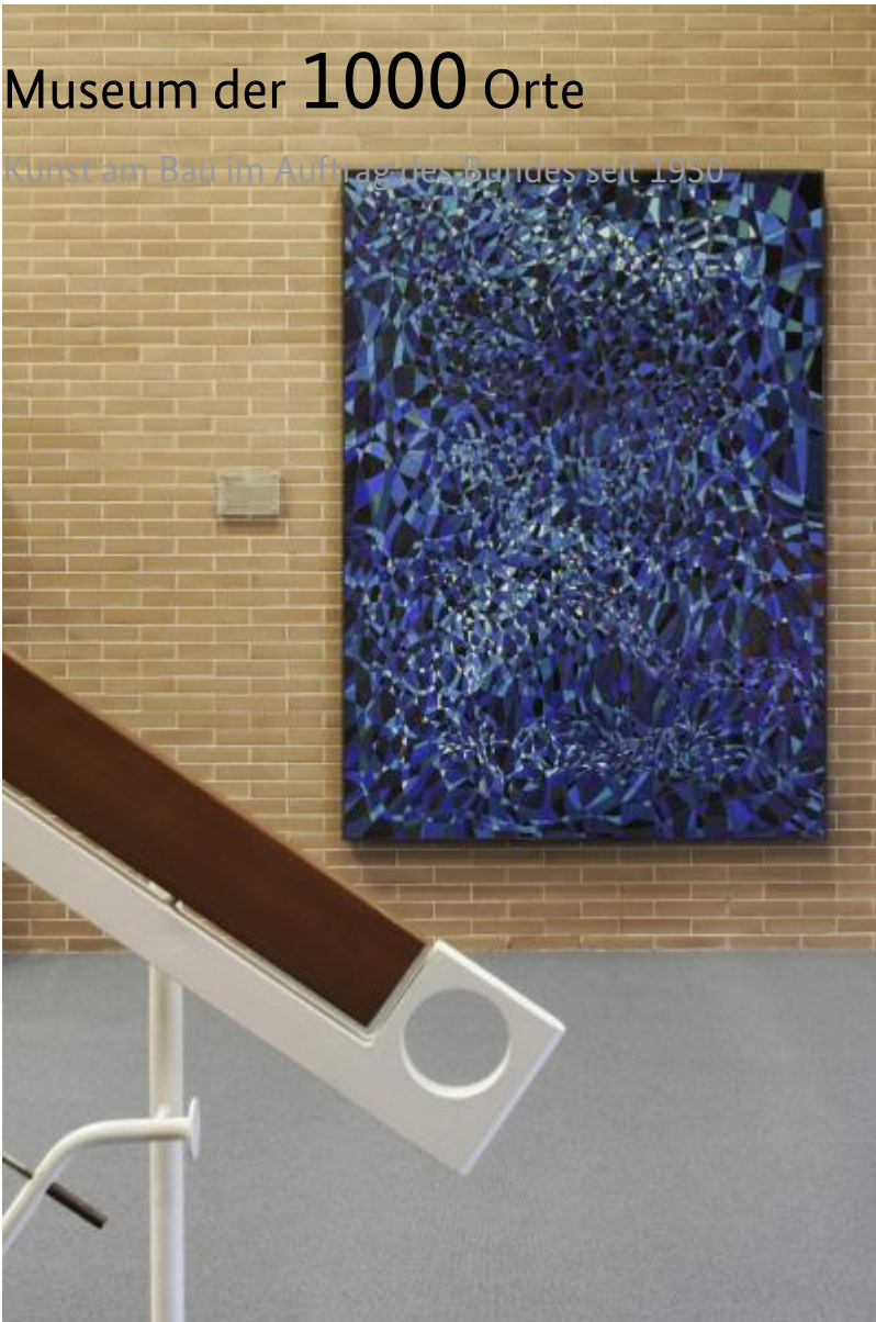
Hans Kaiser: Steine, 1970 / © Hans Kaiser

Kunst am Bau im Auftrag des Bundes seit 1950