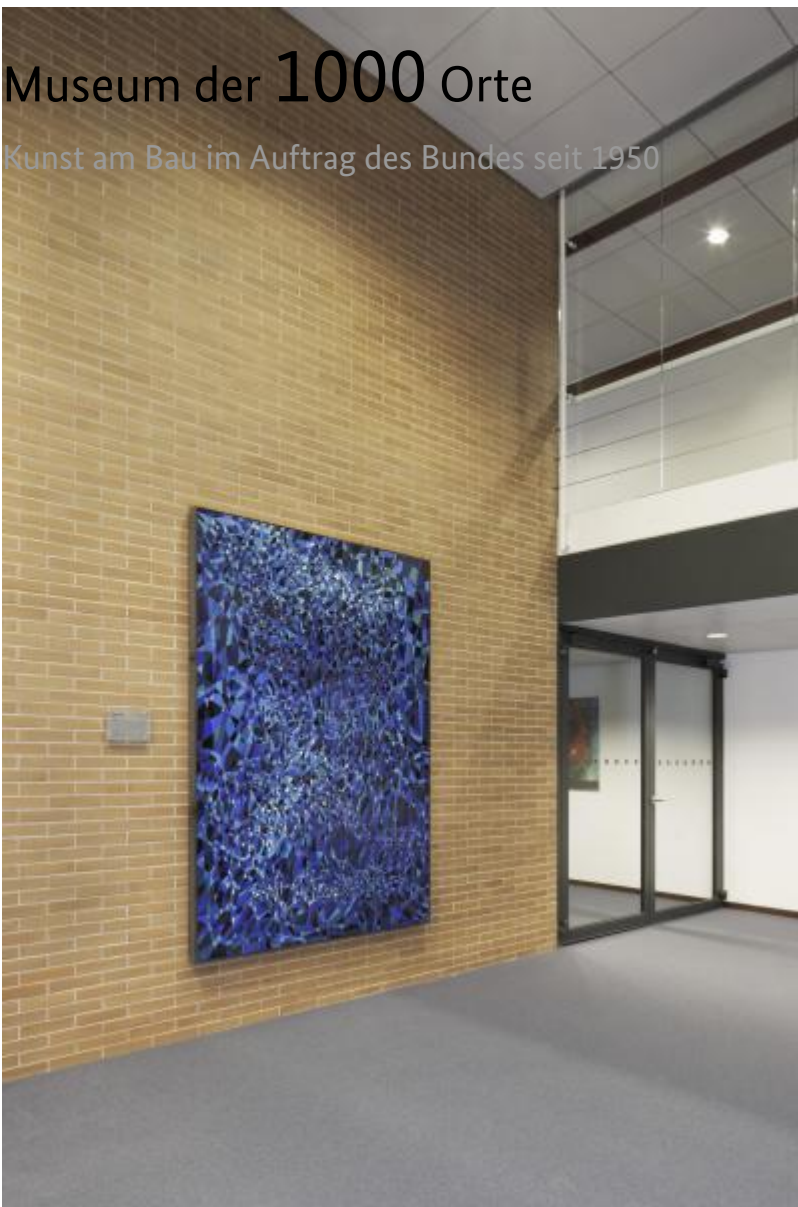
Hans Kaiser: Steine, 1970 / © Hans Kaiser

Kunst am Bau im Auftrag des Bundes seit 1950