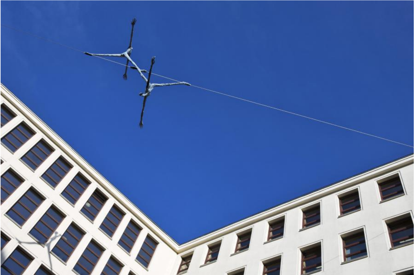
TRAK Wendisch: Seiltänzer, 2001 / © VG Bild-Kunst, Bonn; Fotonachweis: BBR / Sandra Wildemann (2008)