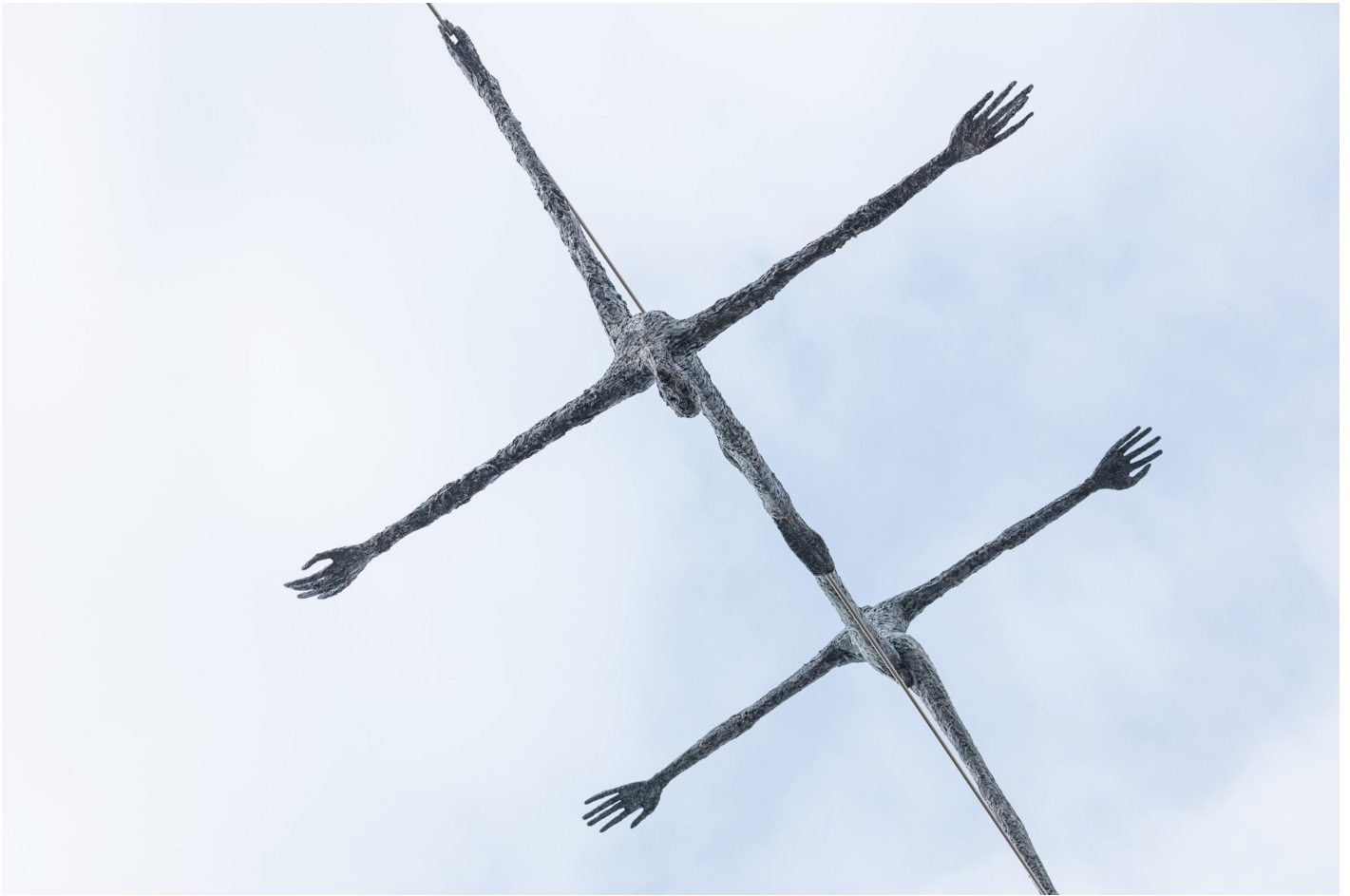
TRAK Wendisch: Seiltänzer, 2001 / © VG Bild-Kunst, Bonn; Fotonachweis: BBR / Cordia Schlegelmilch (2016)

Kunst am Bau im Auftrag des Bundes seit 1950