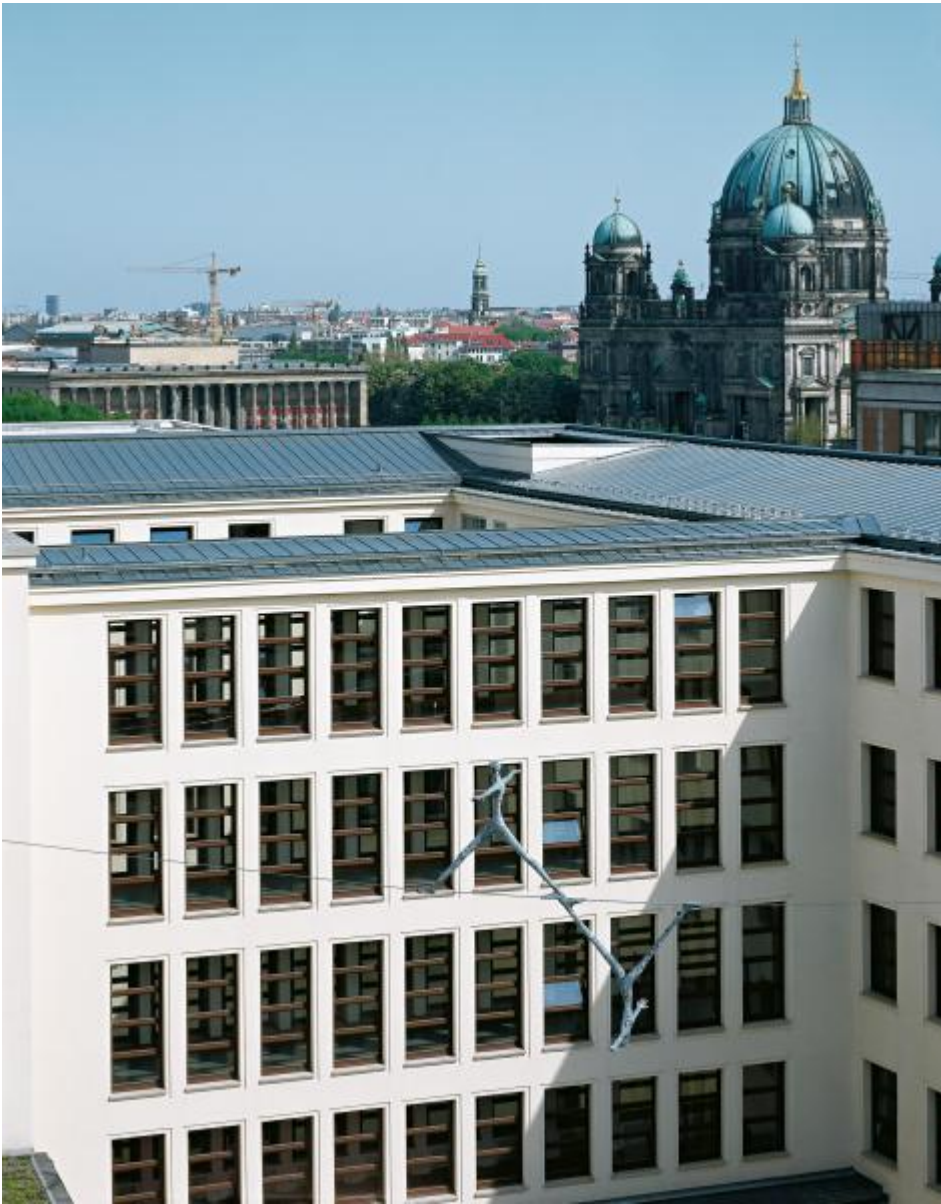
TRAK Wendisch: Seiltänzer, 2001 / © VG Bild-Kunst, Bonn; Fotonachweis: BBR / Stefan Müller (2001)

Kunst am Bau im Auftrag des Bundes seit 1950