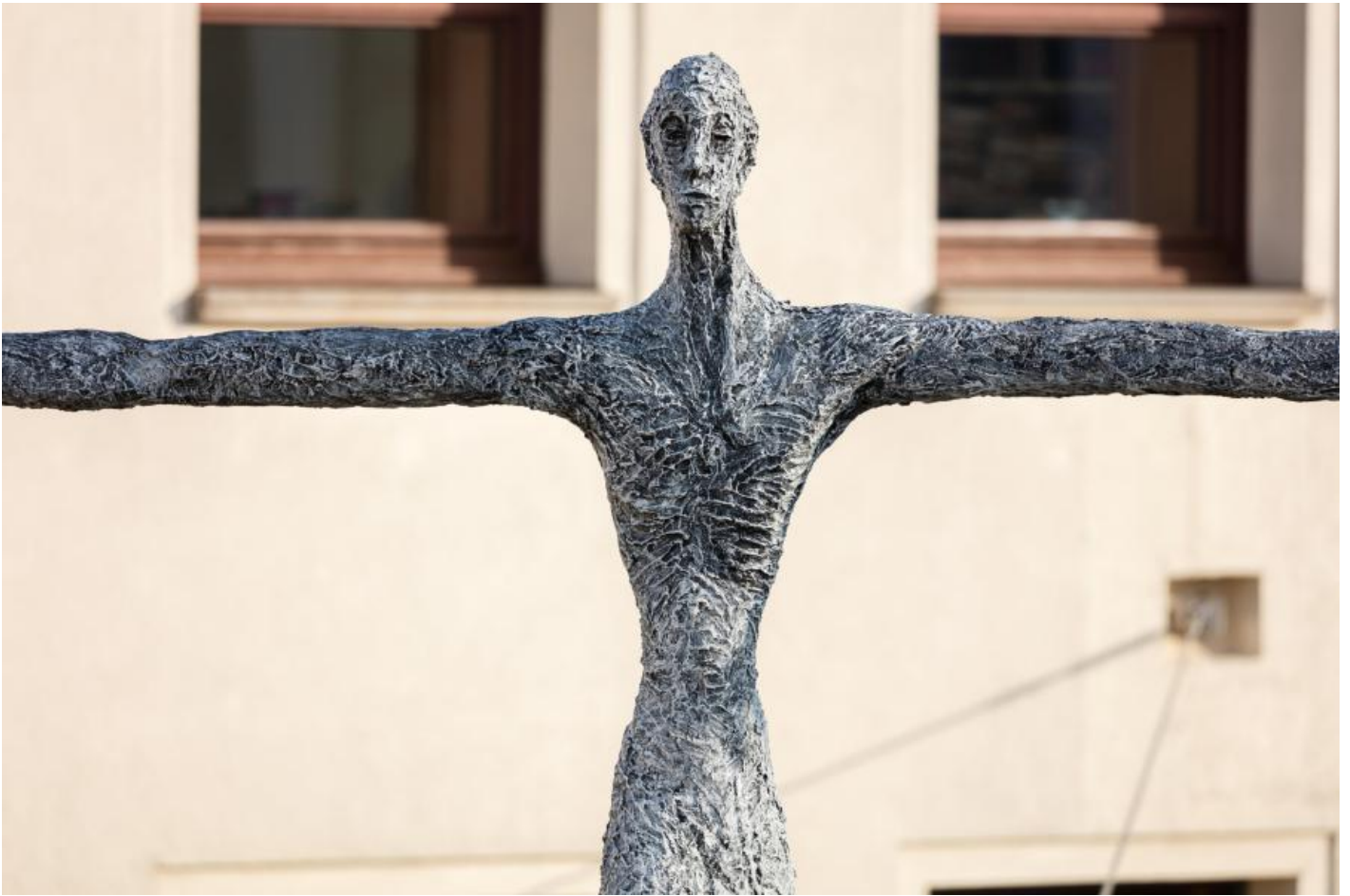
TRAK Wendisch: Seiltänzer, 2001 / © VG Bild-Kunst, Bonn

Kunst am Bau im Auftrag des Bundes seit 1950