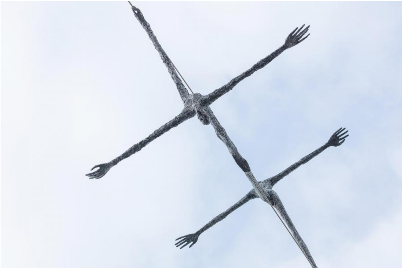
TRAK Wendisch: Seiltänzer, 2001 / © VG Bild-Kunst, Bonn

Kunst am Bau im Auftrag des Bundes seit 1950