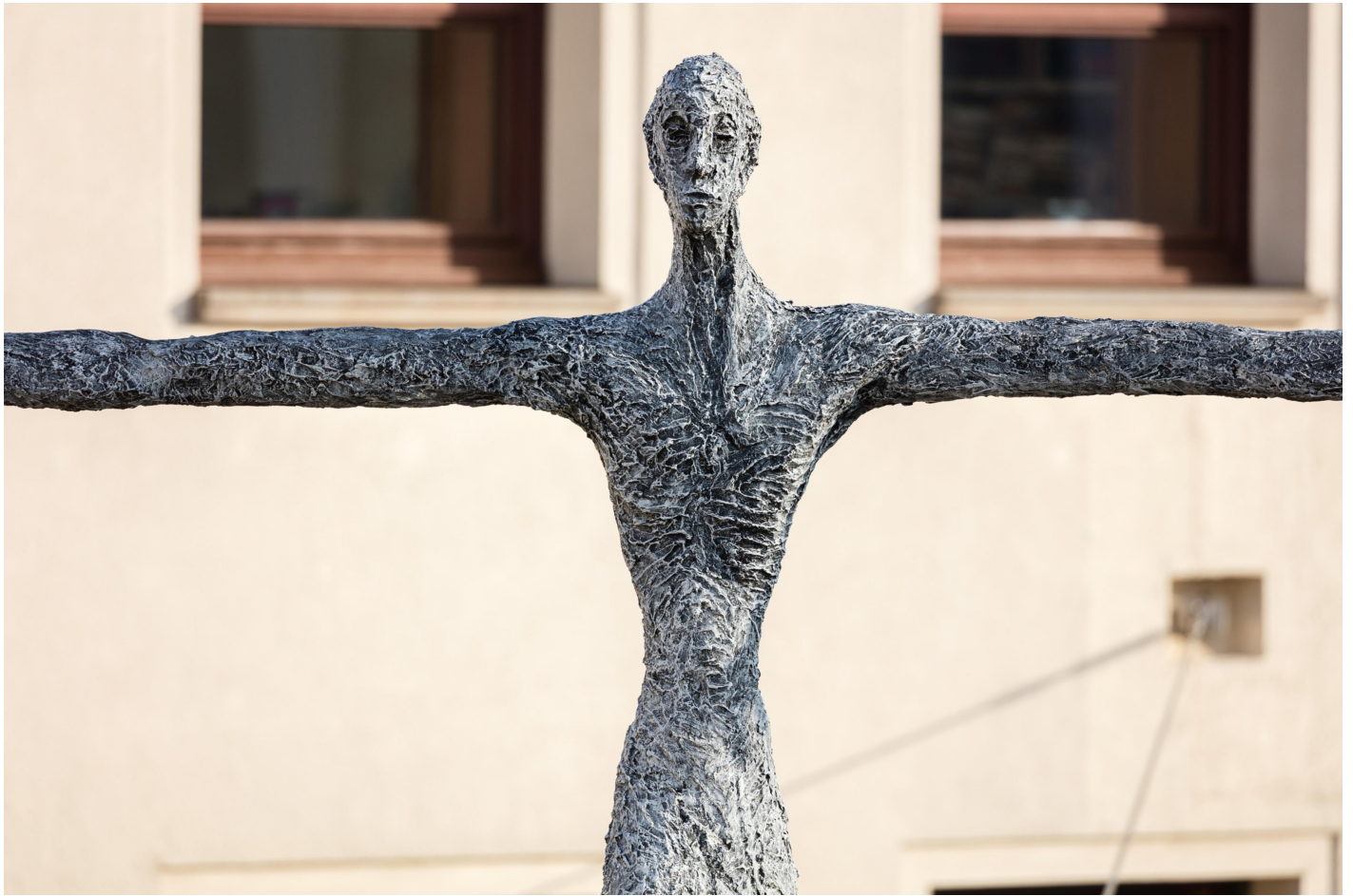
TRAK Wendisch: Seiltänzer, 2001 / © VG Bild-Kunst, Bonn

Kunst am Bau im Auftrag des Bundes seit 1950