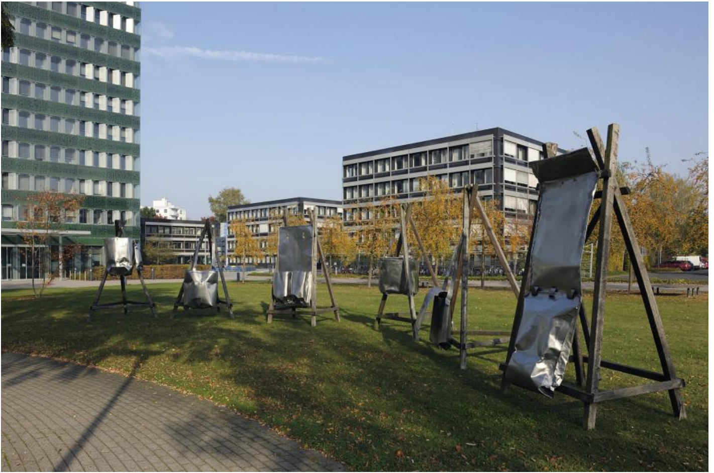
Ansgar Nierhoff: Sechs Assoziationsträger, 1979 / © VG Bild-Kunst, Bonn; Fotonachweis: BBR / Bernd Hiepe (2015)

Kunst am Bau im Auftrag des Bundes seit 1950