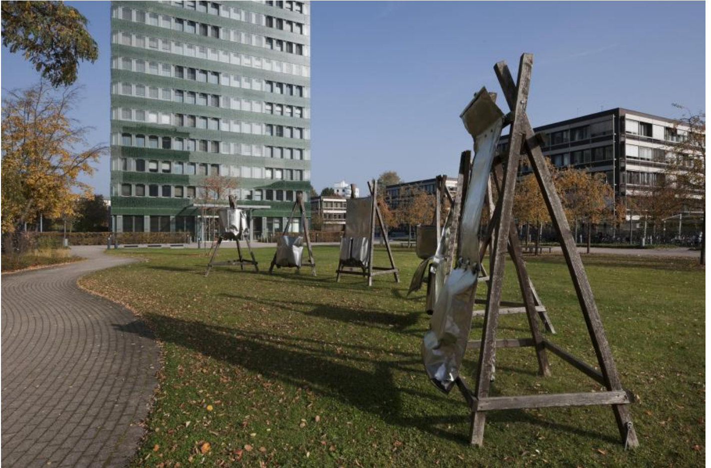
Ansgar Nierhoff: Sechs Assoziationsträger, 1979 / © VG Bild-Kunst, Bonn; Fotonachweis: BBR / Bernd Hiepe (2015)