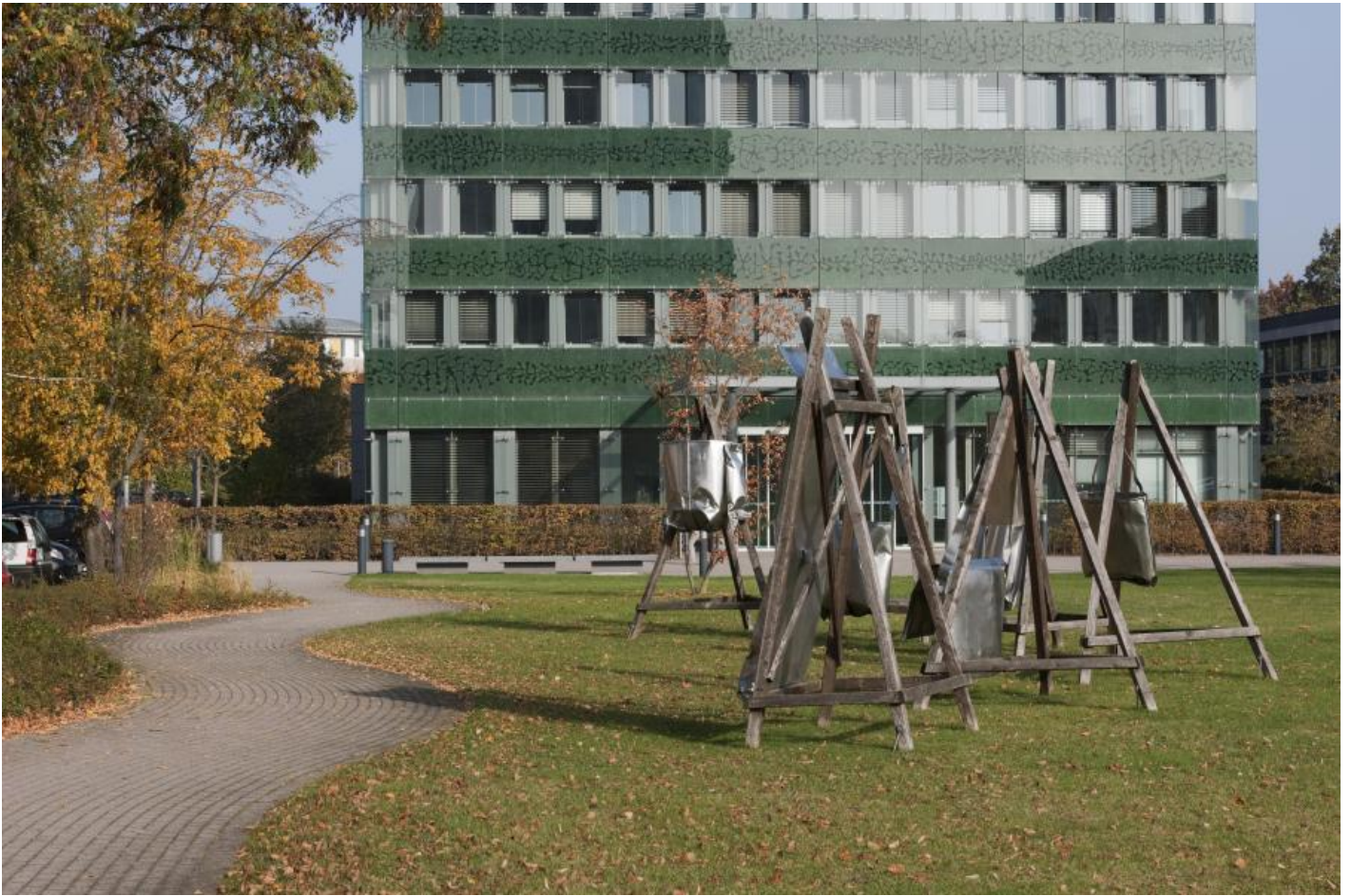
Ansgar Nierhoff: Sechs Assoziationsträger, 1979 / © VG Bild-Kunst, Bonn

Kunst am Bau im Auftrag des Bundes seit 1950