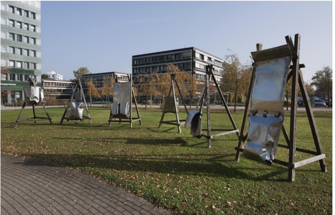
Ansgar Nierhoff: Sechs Assoziationsträger, 1979 / © VG Bild-Kunst, Bonn; Fotonachweis: BBR / Bernd Hiepe (2015)

Kunst am Bau im Auftrag des Bundes seit 1950