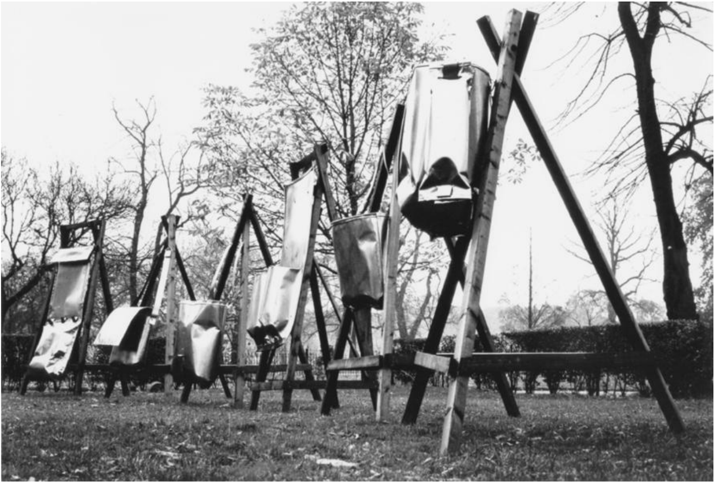
Ansgar Nierhoff: Sechs Assoziationsträger, 1979 / © VG Bild-Kunst, Bonn; Fotonachweis: Archiv BBR

Kunst am Bau im Auftrag des Bundes seit 1950