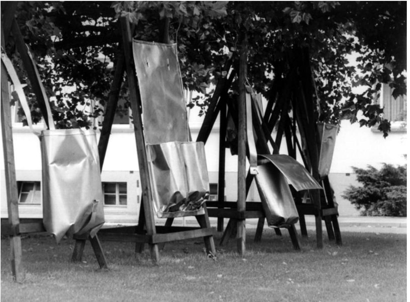
Ansgar Nierhoff: Sechs Assoziationsträger, 1979 / © VG Bild-Kunst, Bonn

Kunst am Bau im Auftrag des Bundes seit 1950