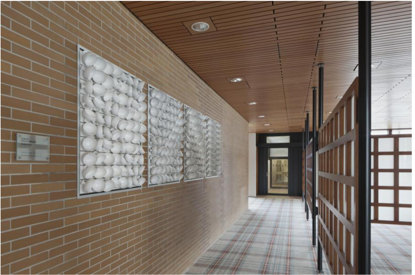
Angelika Baasner-Matussek: Schalenrelief, 1970 / © Angelika Baasner-Matussek; Fotonachweis: BBR / Werner Huthmacher (2011)

Kunst am Bau im Auftrag des Bundes seit 1950