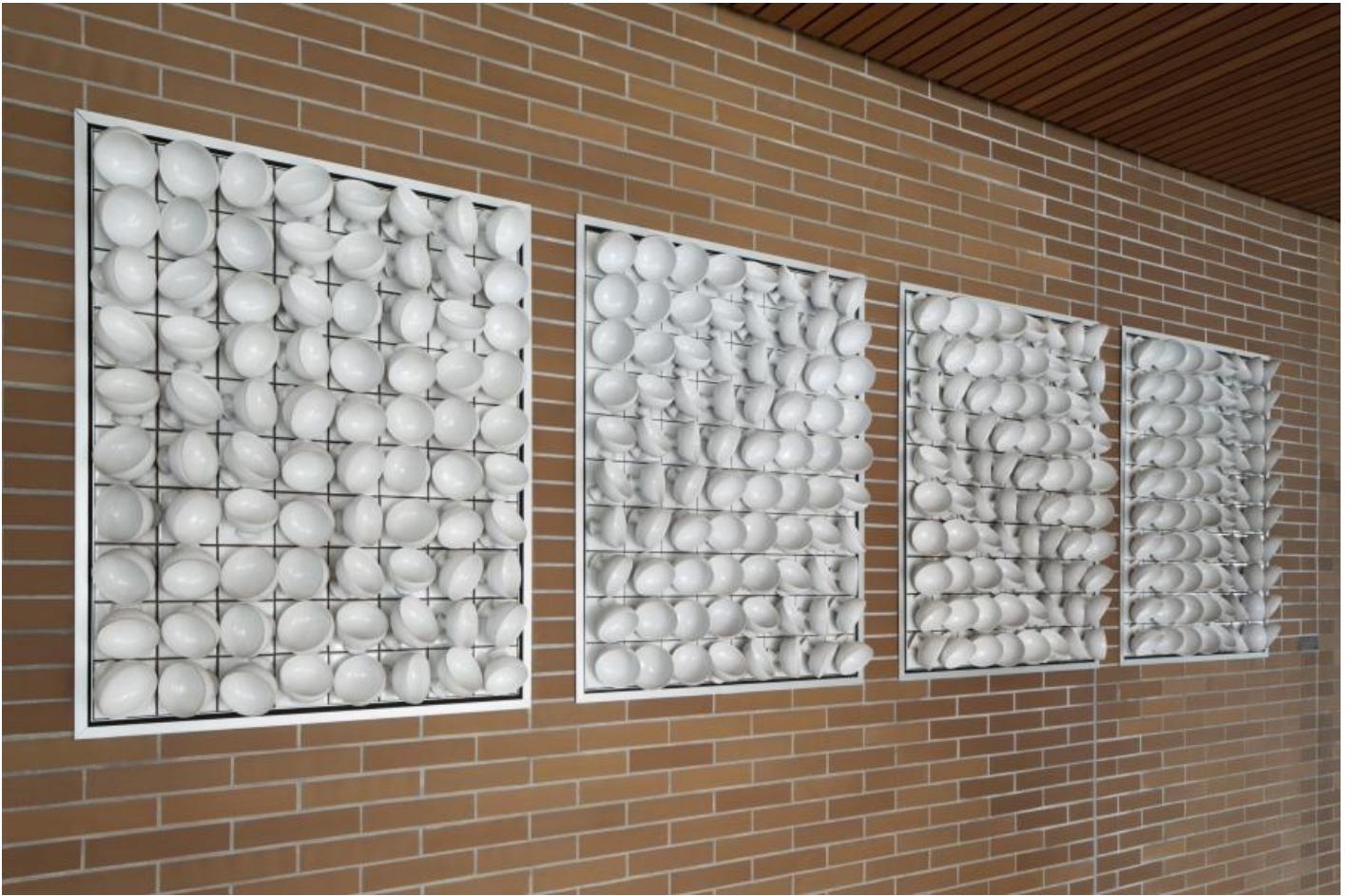
Angelika Baasner-Matussek: Schalenrelief, 1970 / © Angelika Baasner-Matussek

Kunst am Bau im Auftrag des Bundes seit 1950