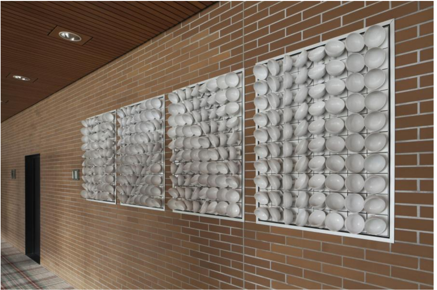
Angelika Baasner-Matussek: Schalenrelief, 1970 / © Angelika Baasner-Matussek; Fotonachweis: BBR / Werner Huthmacher (2011)

Kunst am Bau im Auftrag des Bundes seit 1950