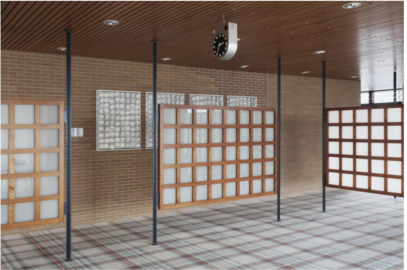
Angelika Baasner-Matussek: Schalenrelief, 1970 / © Angelika Baasner-Matussek

Kunst am Bau im Auftrag des Bundes seit 1950