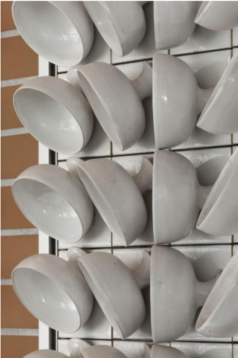
Angelika Baasner-Matussek: Schalenrelief, 1970 / © Angelika Baasner-Matussek; Fotonachweis: BBR / Werner Huthmacher (2011)

Kunst am Bau im Auftrag des Bundes seit 1950