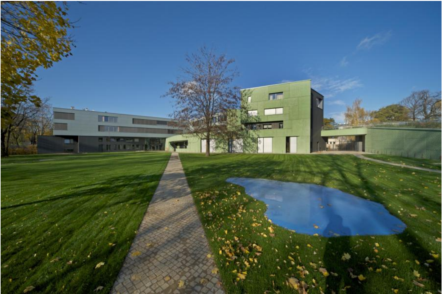
Rainer Splitt: Reflecting Pool, 2007 / © VG Bild-Kunst, Bonn

Kunst am Bau im Auftrag des Bundes seit 1950