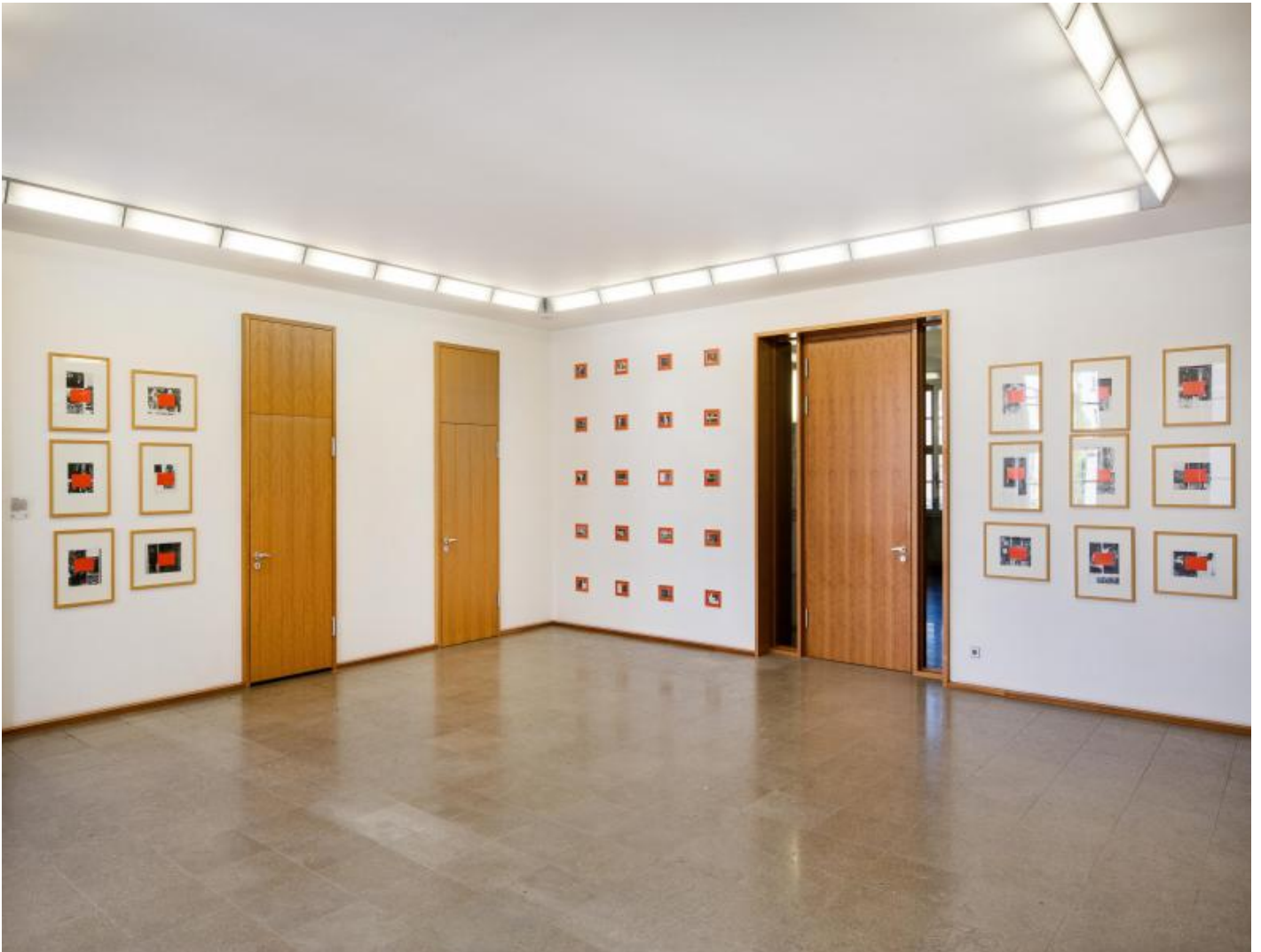
Thom Barth: Raster D, 2000 / © VG Bild-Kunst, Bonn

Kunst am Bau im Auftrag des Bundes seit 1950