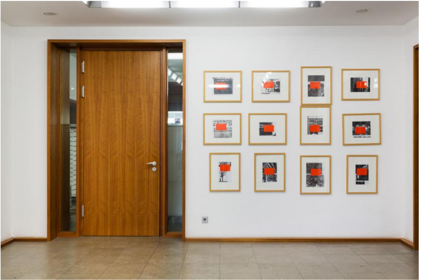
Thom Barth: Raster D, 2000 / © VG Bild-Kunst, Bonn

Kunst am Bau im Auftrag des Bundes seit 1950