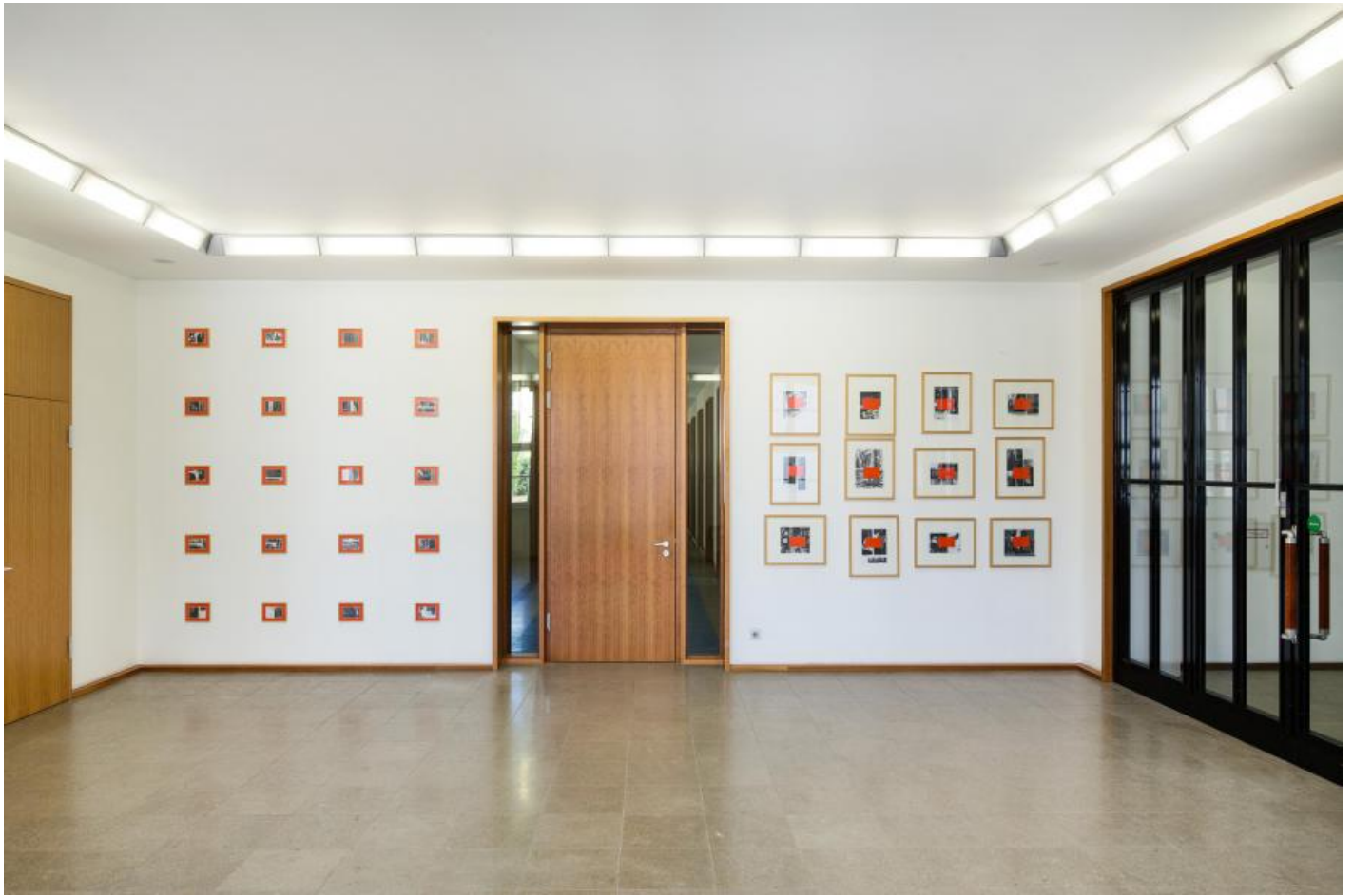
Thom Barth: Raster D, 2000 / © VG Bild-Kunst, Bonn; Fotonachweis: BBR / Cordia Schlegelmilch (2015)

Kunst am Bau im Auftrag des Bundes seit 1950