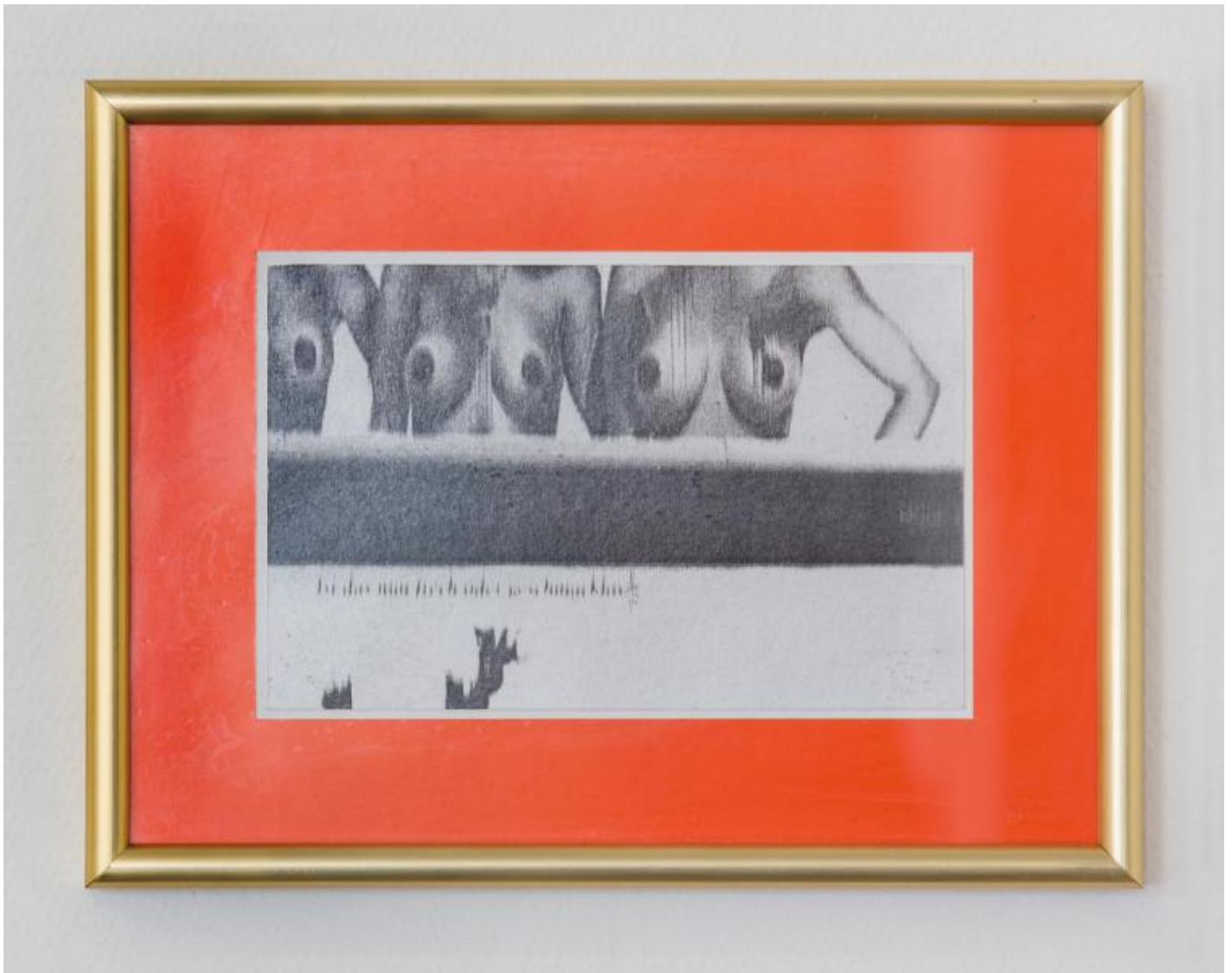
Thom Barth: Raster D, 2000 / © VG Bild-Kunst, Bonn

Kunst am Bau im Auftrag des Bundes seit 1950