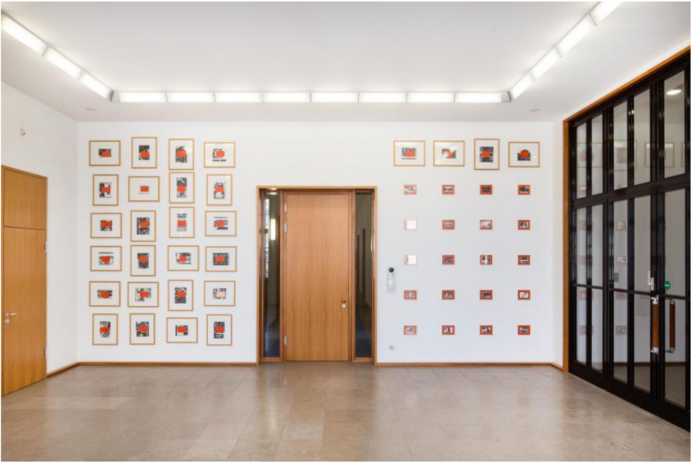
Thom Barth: Raster D, 2000 / © VG Bild-Kunst, Bonn

Kunst am Bau im Auftrag des Bundes seit 1950