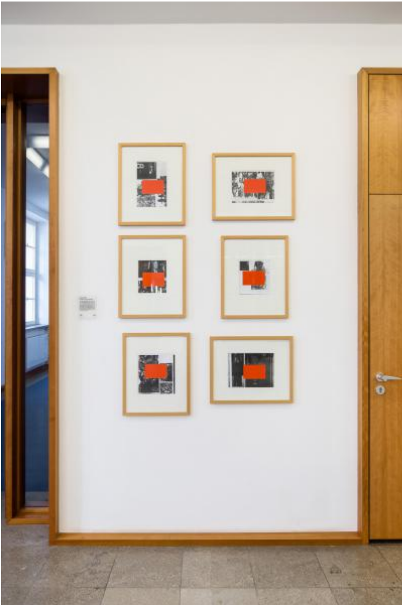
Thom Barth: Raster D, 2000 / © VG Bild-Kunst, Bonn; Fotonachweis: BBR / Cordia Schlegelmilch (2015)

Kunst am Bau im Auftrag des Bundes seit 1950