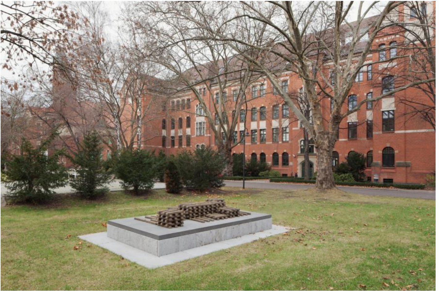
Fritz Balhaus: Pure Moore, 2009 / © VG Bild-Kunst, Bonn; Fotonachweis: BBR / Werner Huthmacher (2011)

Kunst am Bau im Auftrag des Bundes seit 1950