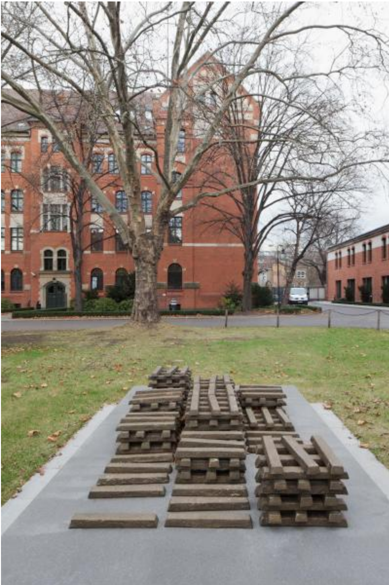
Fritz Balhaus: Pure Moore, 2009 / © VG Bild-Kunst, Bonn; Fotonachweis: BBR / Werner Huthmacher (2011)

Kunst am Bau im Auftrag des Bundes seit 1950