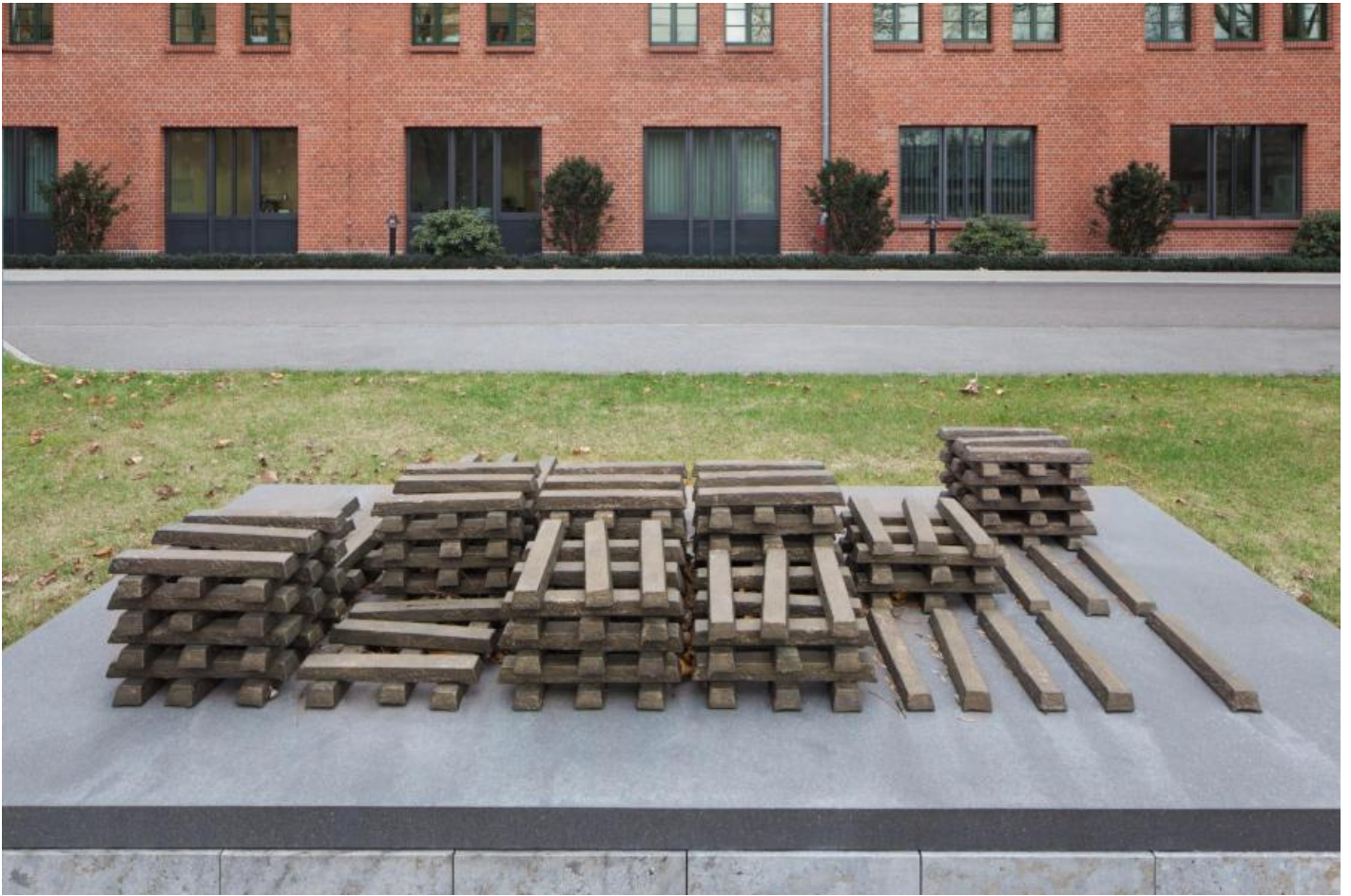
Fritz Balhaus: Pure Moore, 2009 / © VG Bild-Kunst, Bonn; Fotonachweis: BBR / Werner Huthmacher (2011)

Kunst am Bau im Auftrag des Bundes seit 1950