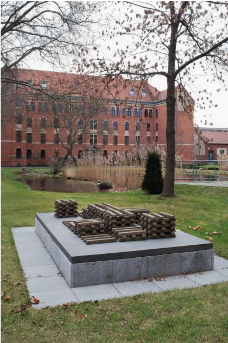
Fritz Balhaus: Pure Moore, 2009 / © VG Bild-Kunst, Bonn

Kunst am Bau im Auftrag des Bundes seit 1950