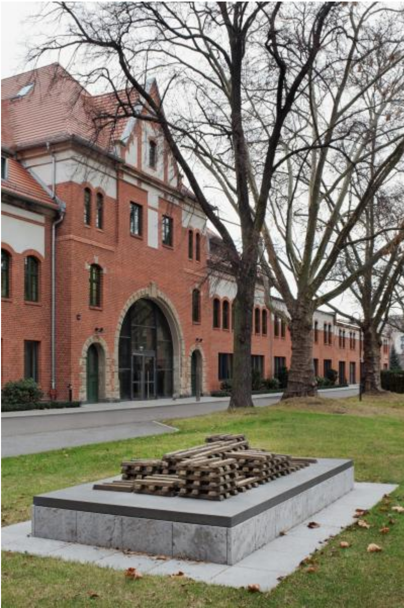
Fritz Balhaus: Pure Moore, 2009 / © VG Bild-Kunst, Bonn; Fotonachweis: BBR / Werner Huthmacher (2011)

Kunst am Bau im Auftrag des Bundes seit 1950