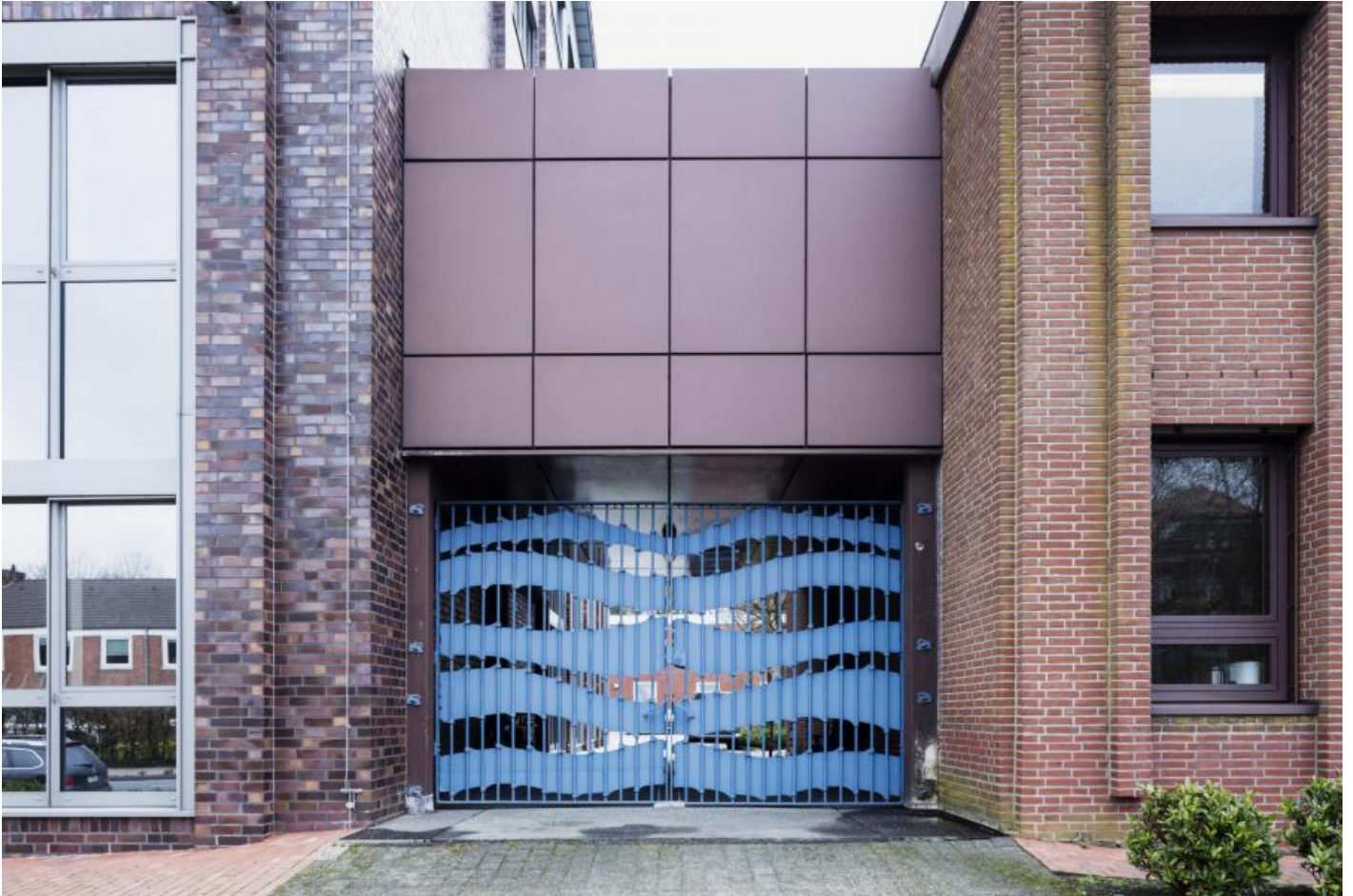
Klaus Bösselmann: o. T. (Toranlage), 1983 / © Klaus Bösselmann