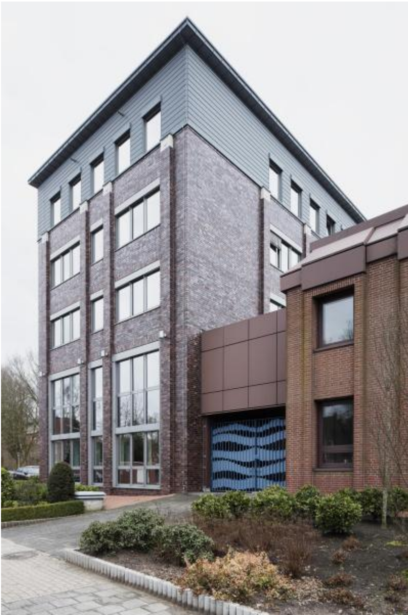
Klaus Bösselmann: o. T. (Toranlage), 1983 / © Klaus Bösselmann; Fotonachweis: BBR / Cordia Schlegelmilch (2017)

Kunst am Bau im Auftrag des Bundes seit 1950