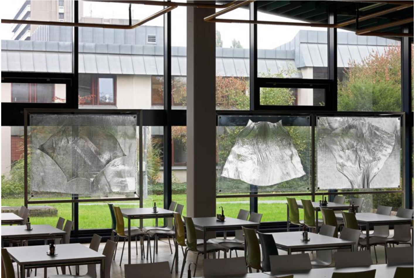
Heinz Mack: o. T. (Drei Fenster-Flügel), 1979 / © VG Bild-Kunst, Bonn; Fotonachweis: BBR / Cordia Schlegelmilch (2013)