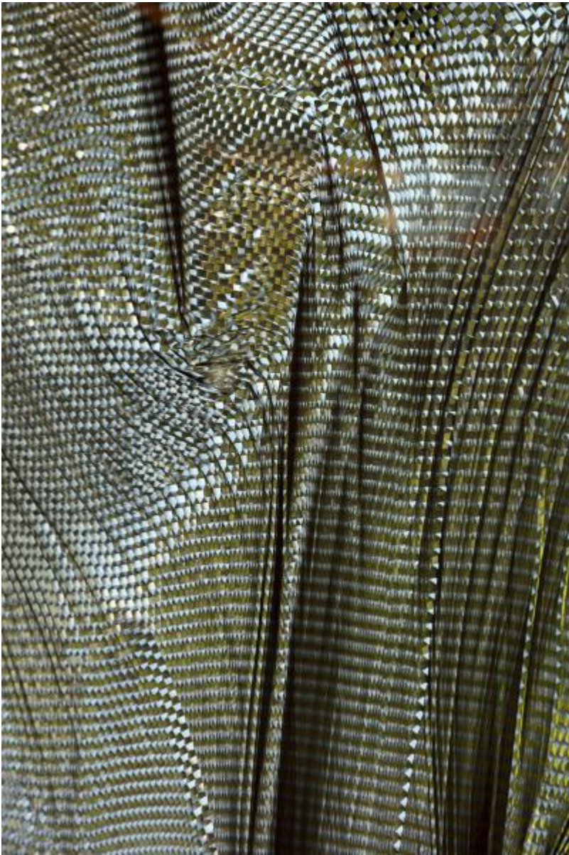
Heinz Mack: o. T. (Drei Fenster-Flügel), 1979 / © VG Bild-Kunst, Bonn; Fotonachweis: BBR / Cordia Schlegelmilch (2013)

Kunst am Bau im Auftrag des Bundes seit 1950