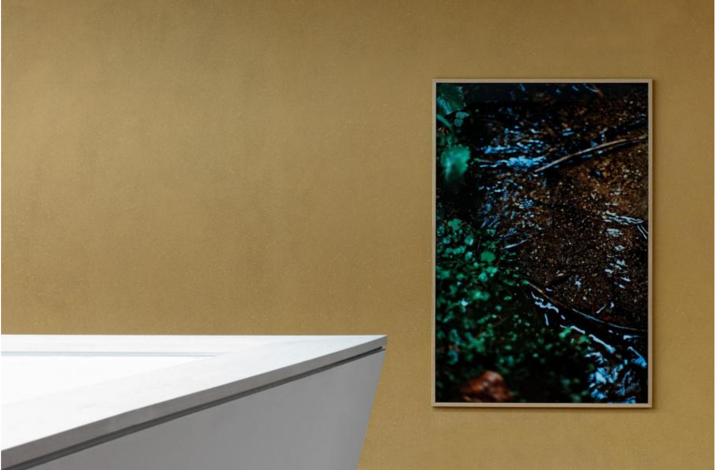
Frank Stürmer: o. T. (Bayerischer Wald I-VII), 2011 / © Frank Stürmer; Fotonachweis: BBR / Bernd Hiepe (2011)