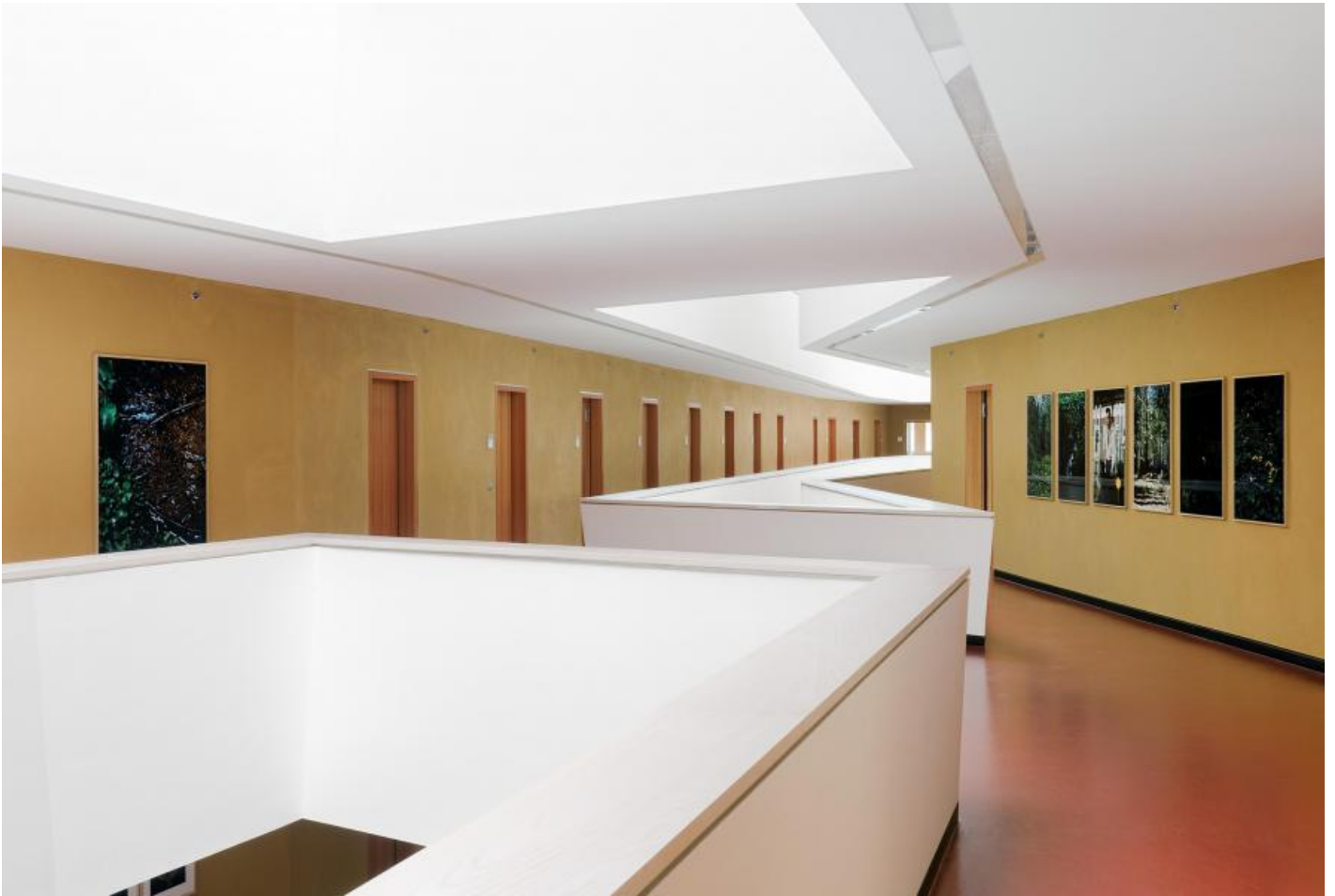
Frank Stürmer: o. T. (Bayerischer Wald I-VII), 2011 / © Frank Stürmer

Kunst am Bau im Auftrag des Bundes seit 1950