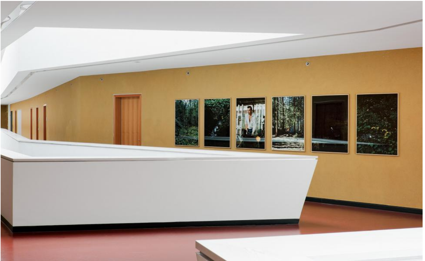
Frank Stürmer: o. T. (Bayerischer Wald I-VII), 2011 / © Frank Stürmer

Kunst am Bau im Auftrag des Bundes seit 1950