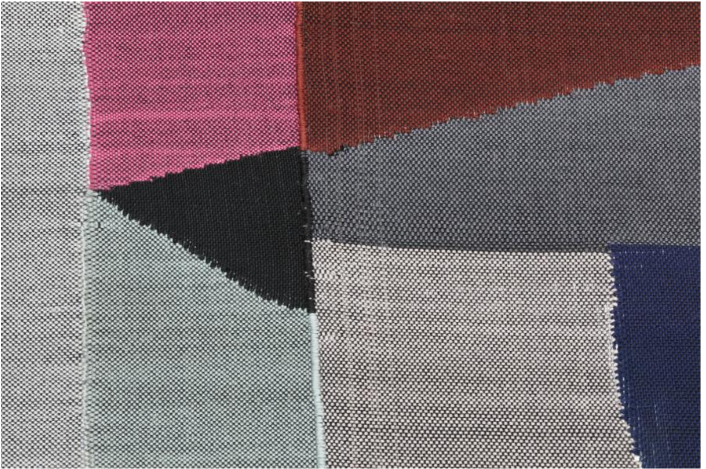
Woty Werner: o. T., 1971 / © Woty Werner; Fotonachweis: BBR / Werner Huthmacher (2011)

Kunst am Bau im Auftrag des Bundes seit 1950