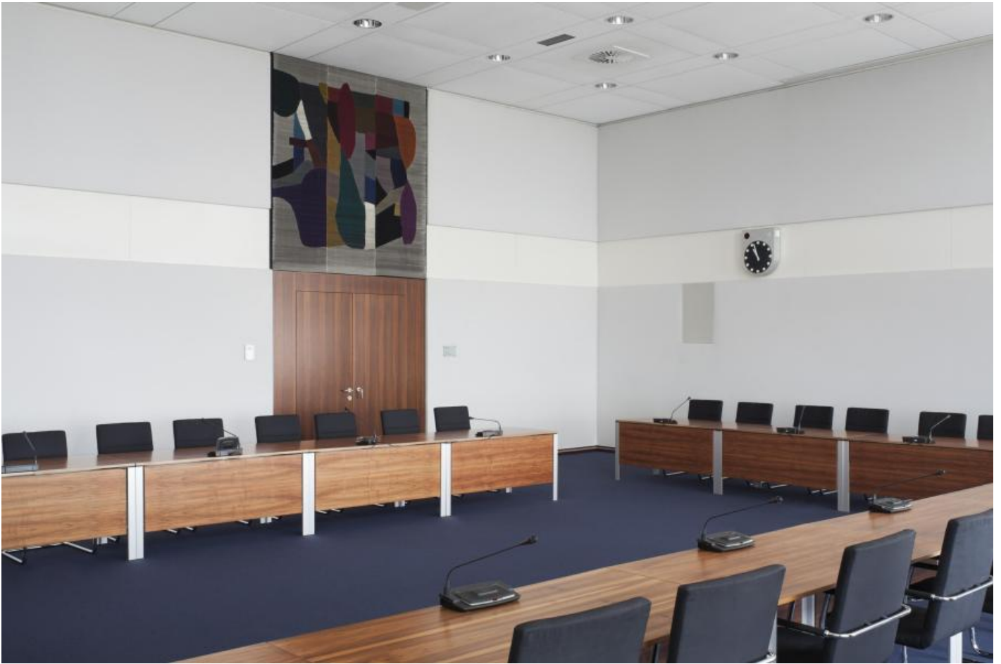
Woty Werner: o. T., 1971 / © Woty Werner

Kunst am Bau im Auftrag des Bundes seit 1950