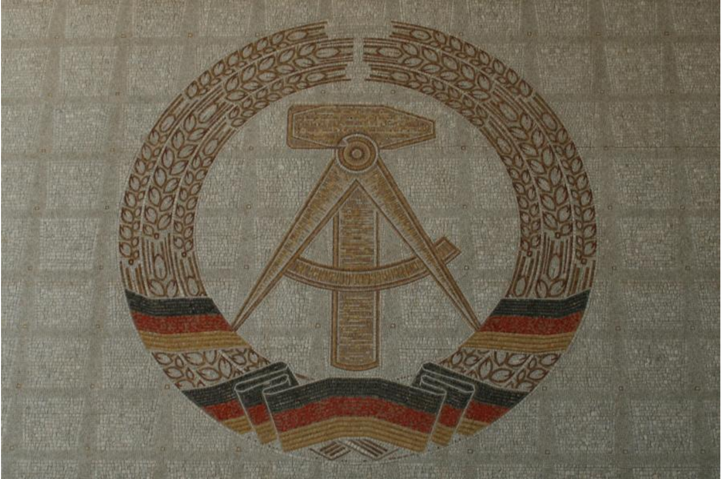
Heinrich Jungebloedt: Mosaik des Staatswappens der DDR, 1964