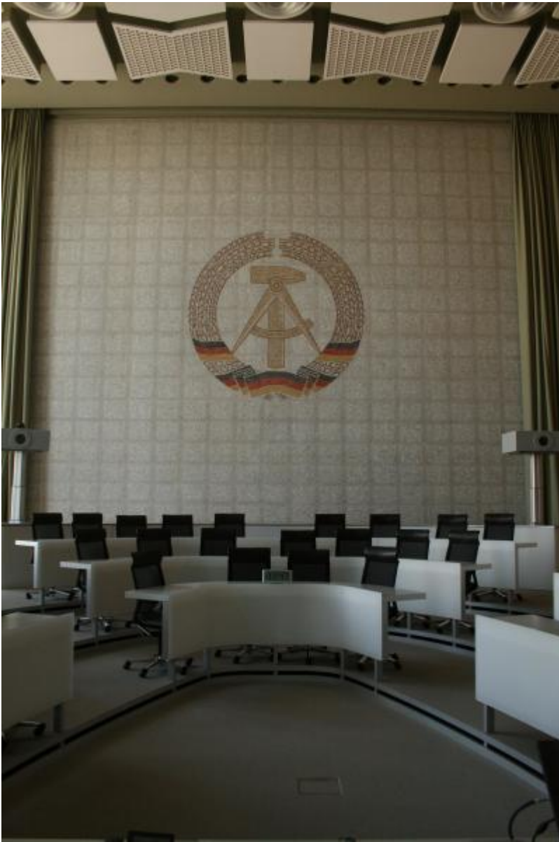
Heinrich Jungebloedt: Mosaik des Staatswappens der DDR, 1964

Kunst am Bau im Auftrag des Bundes seit 1950