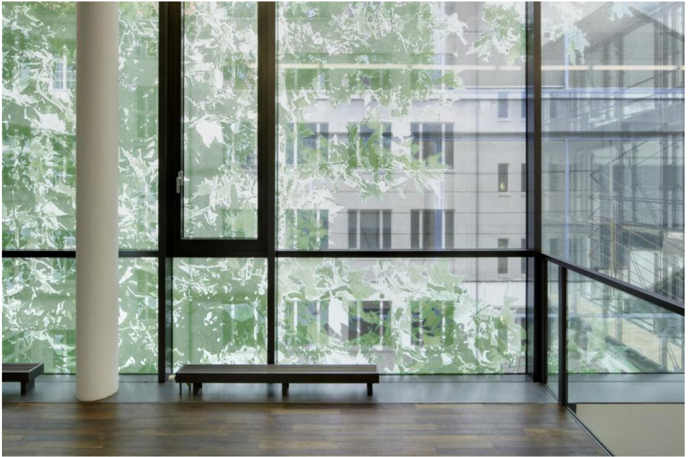
Veronika Kellndorfer: le regard extérieur / le regard intérieur, 2010 / © VG Bild-Kunst, Bonn; Fotonachweis: BBR / Ulrich Schwarz (2010)

Kunst am Bau im Auftrag des Bundes seit 1950