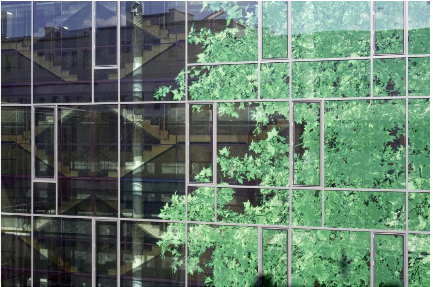
Veronika Kellndorfer: le regard extérieur / le regard intérieur, 2010 / © VG Bild-Kunst, Bonn

Kunst am Bau im Auftrag des Bundes seit 1950