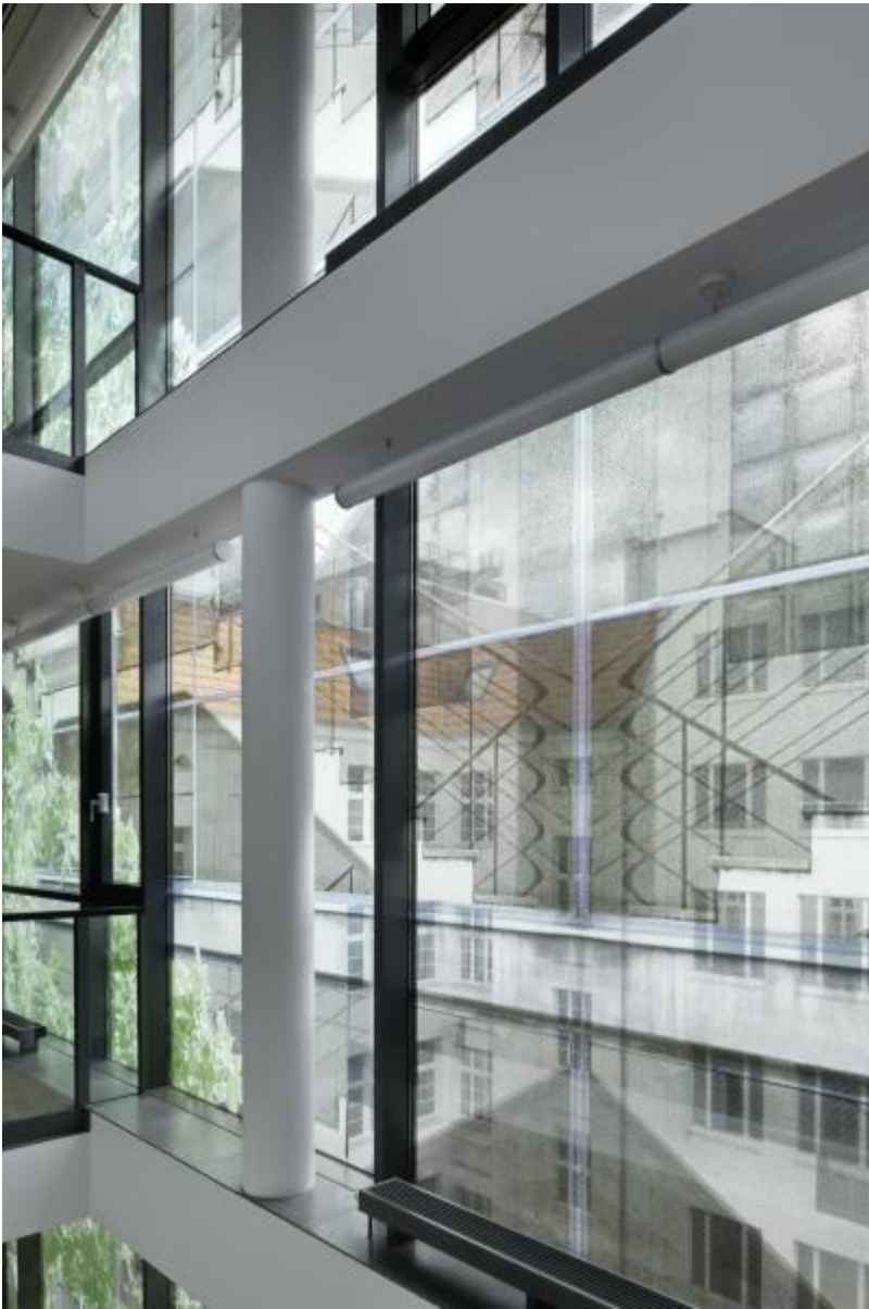
Veronika Kellndorfer: le regard extérieur / le regard intérieur, 2010 / © VG Bild-Kunst, Bonn

Kunst am Bau im Auftrag des Bundes seit 1950