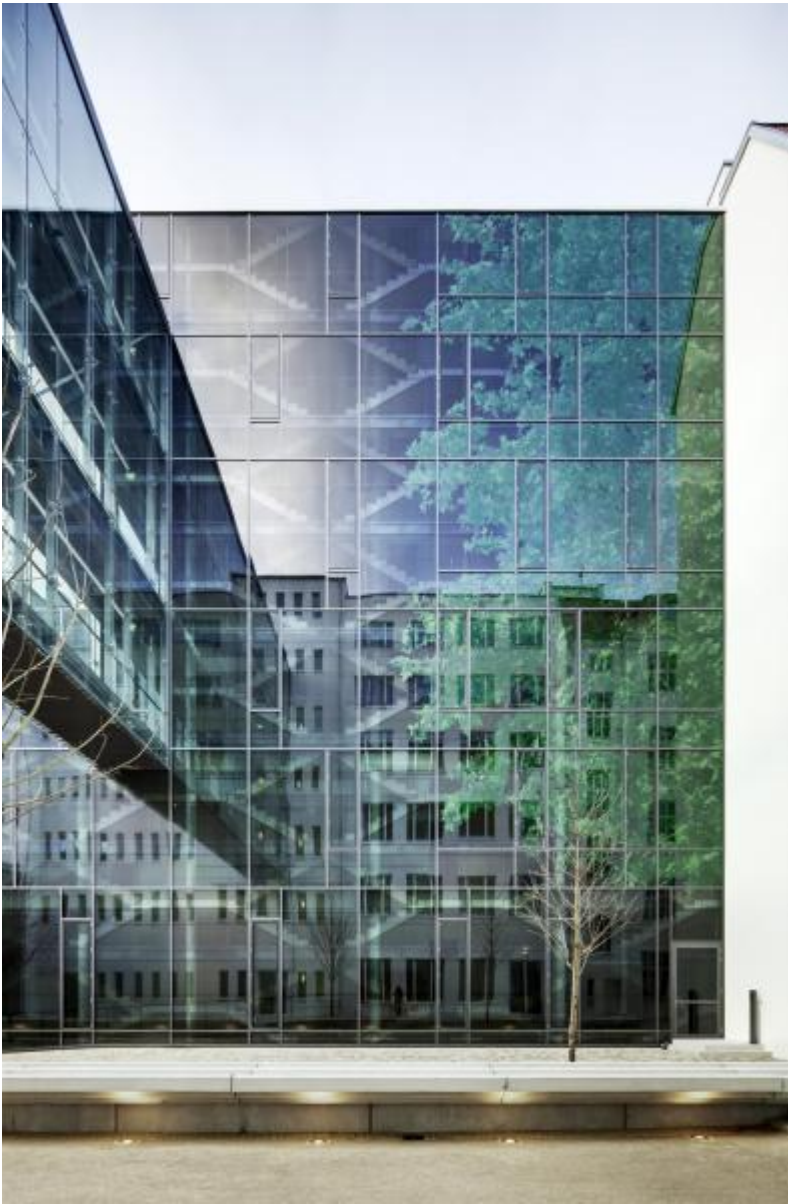
Veronika Kellndorfer: le regard extérieur / le regard intérieur , 2010 / © VG Bild-Kunst, Bonn; Fotonachweis: BBR / Ulrich Schwarz (2010)

Kunst am Bau im Auftrag des Bundes seit 1950