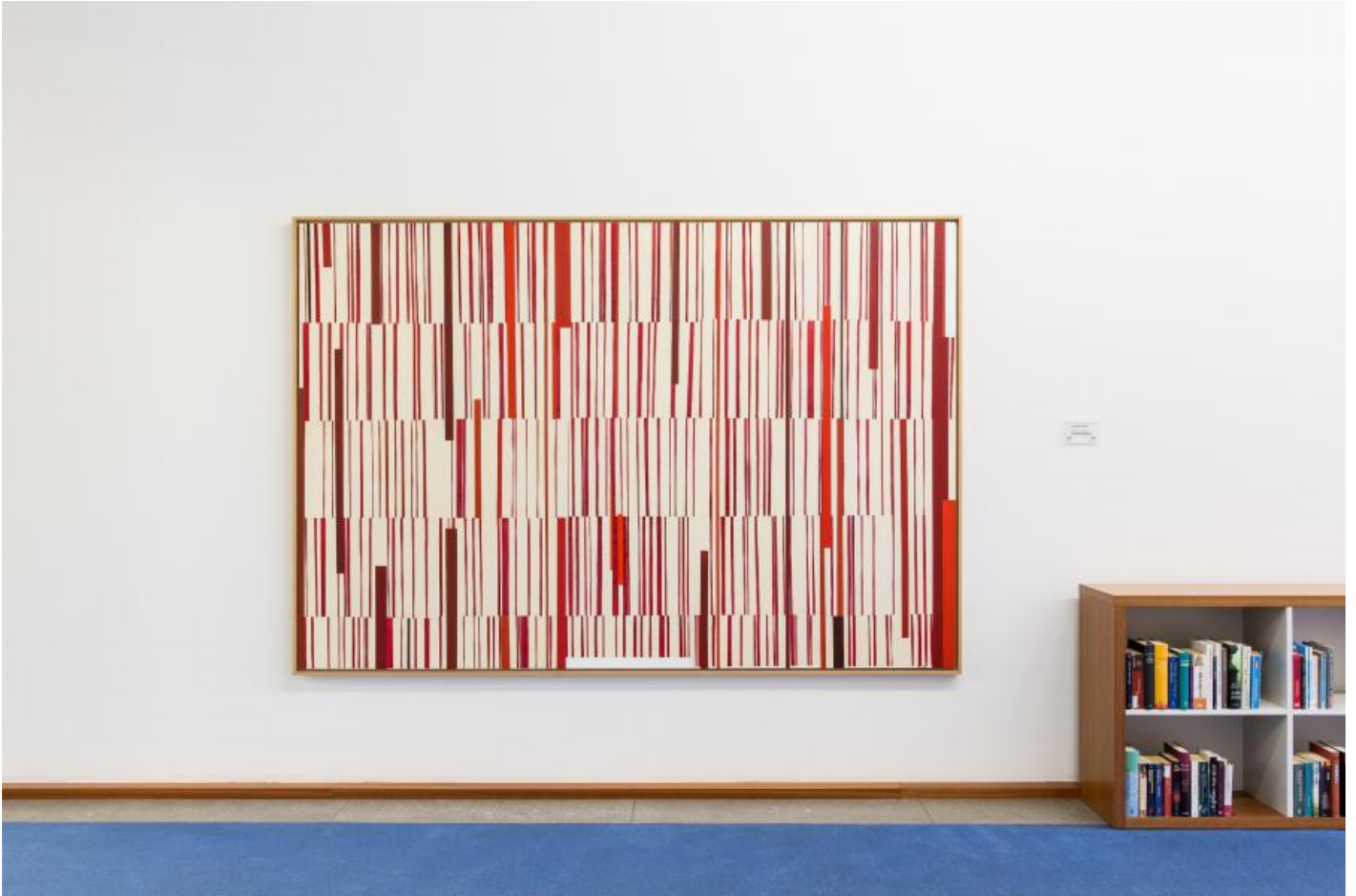
Carsten Nicolai: Information/Schlüssel, 1999 / © VG Bild-Kunst, Bonn; Fotonachweis: BBR / Cordia Schlegelmilch (2015)