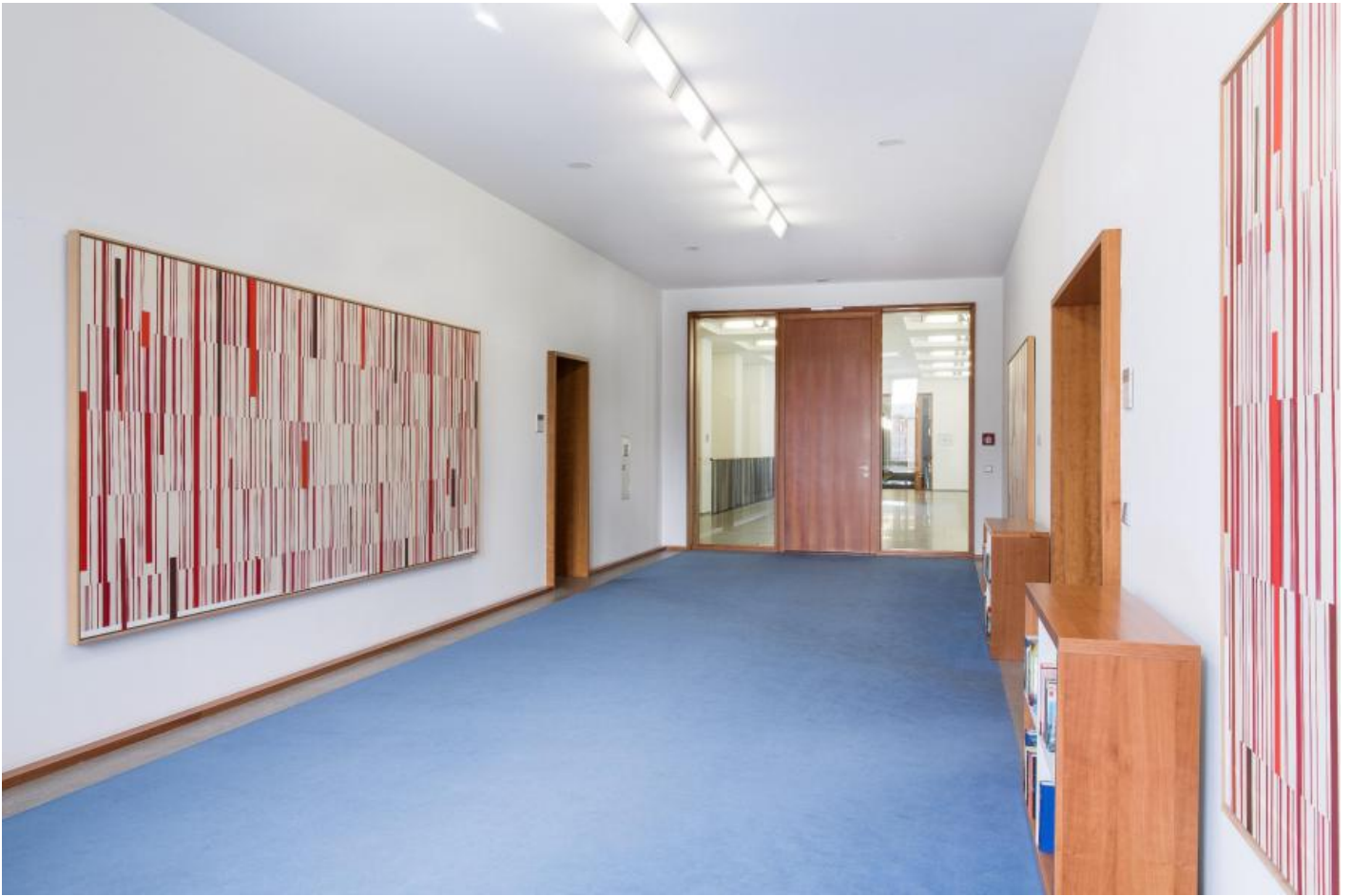
Carsten Nicolai: Information/Schlüssel, 1999

Kunst am Bau im Auftrag des Bundes seit 1950