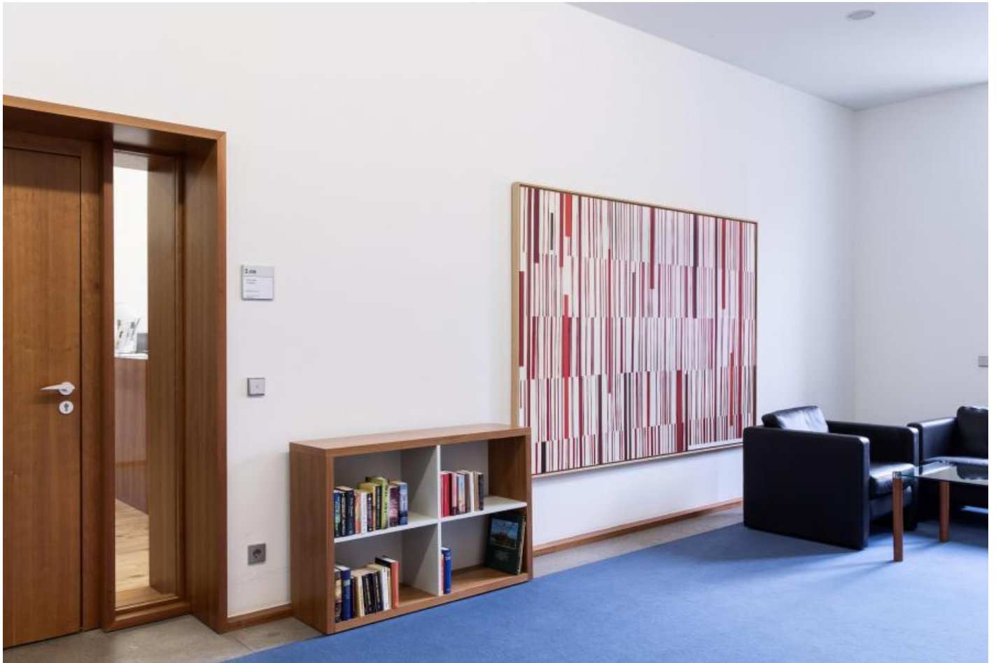
Carsten Nicolai: Information/Schlüssel, 1999 / © VG Bild-Kunst, Bonn

Kunst am Bau im Auftrag des Bundes seit 1950