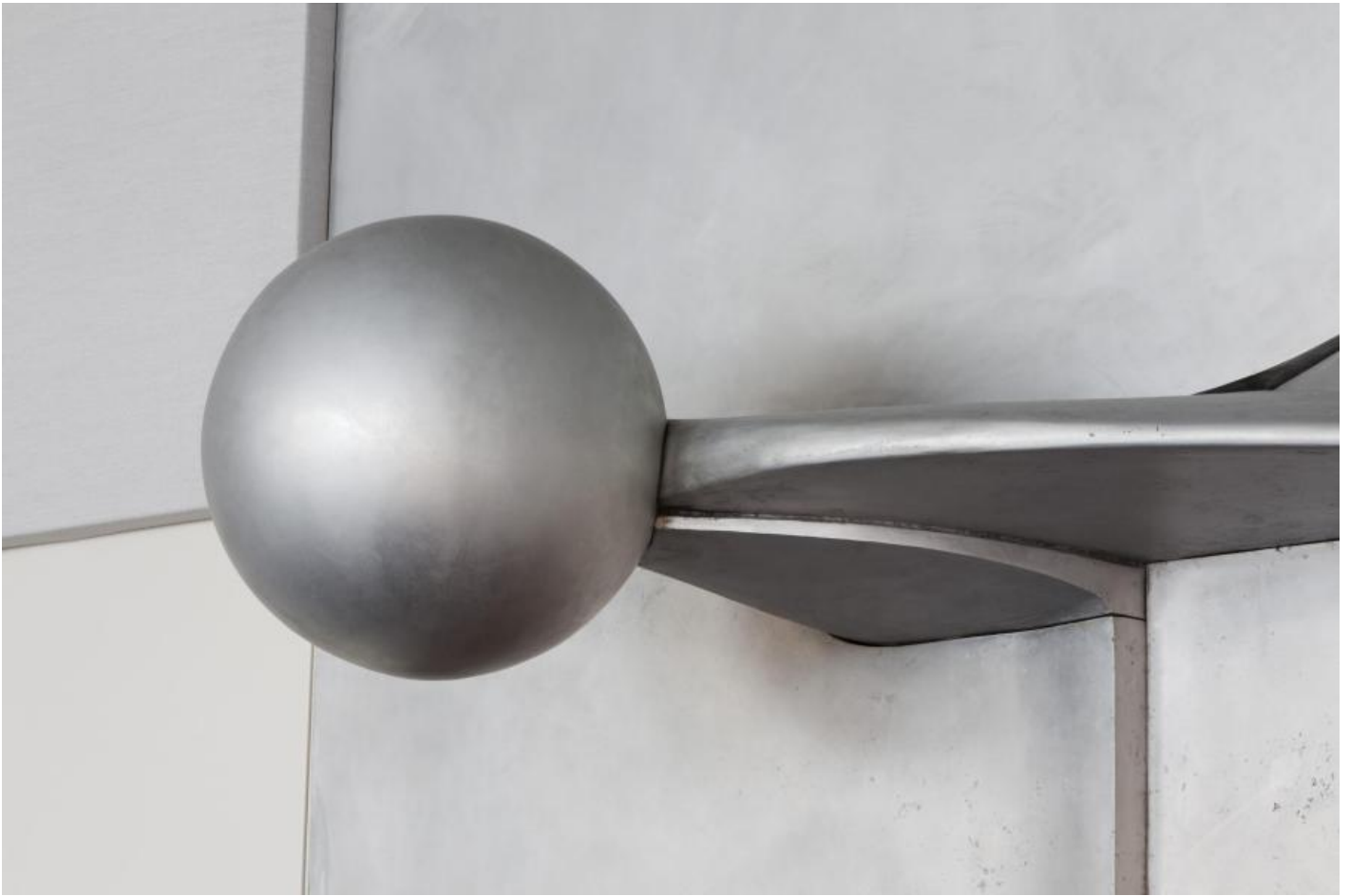
Fritz Koenig: Großes Kugelrelief II, 1970 / © Fritz Koenig

Kunst am Bau im Auftrag des Bundes seit 1950