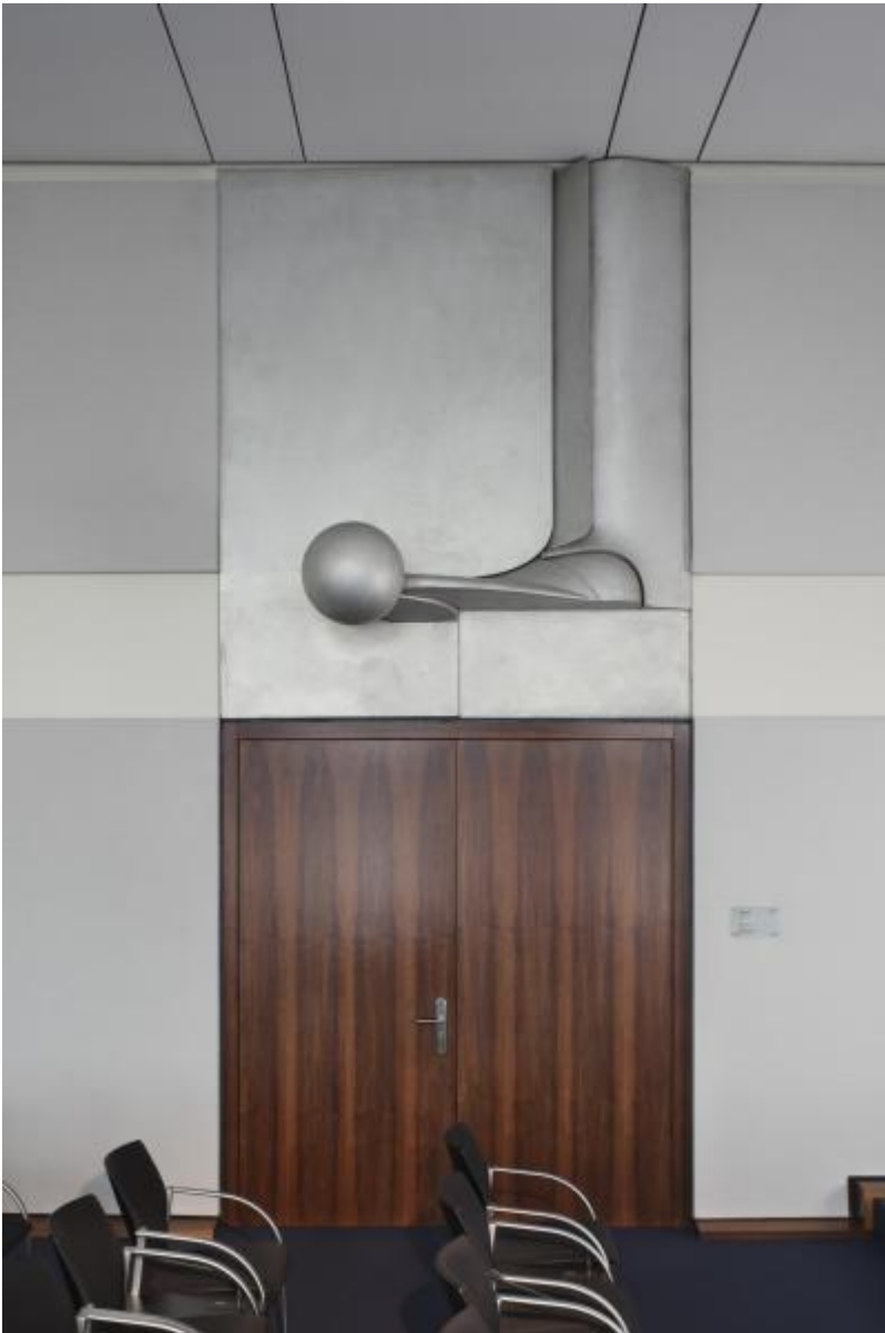
Fritz Koenig: Großes Kugelrelief II, 1970 / © Fritz Koenig

Kunst am Bau im Auftrag des Bundes seit 1950