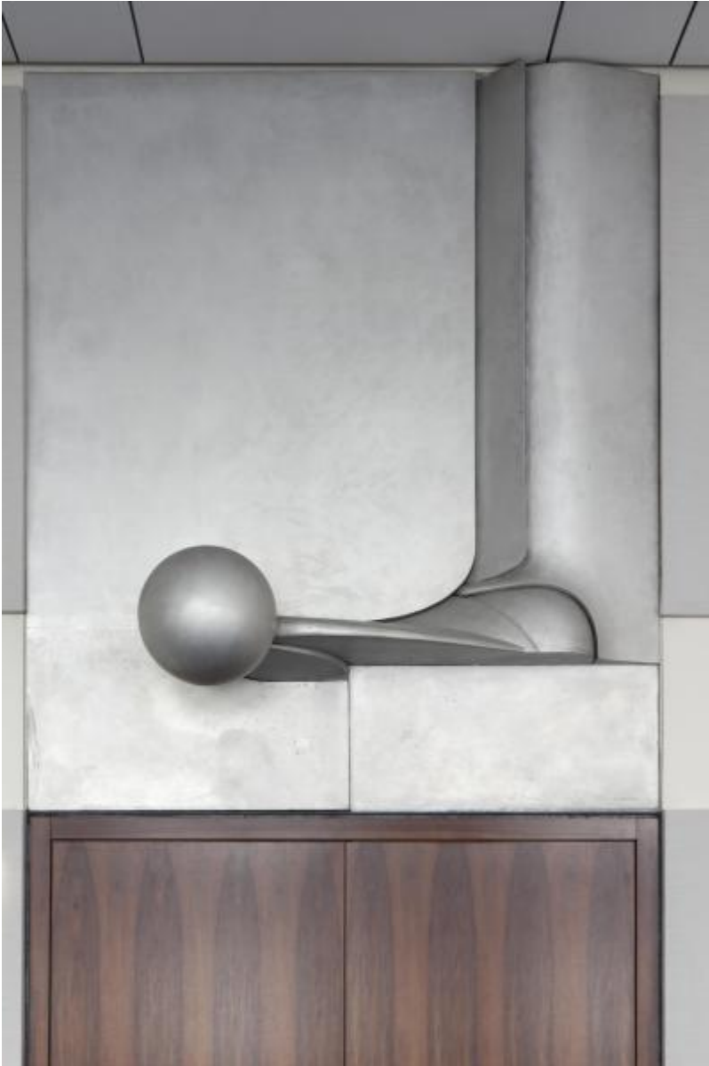
Fritz Koenig: Großes Kugelrelief II, 1970 / © Fritz Koenig; Fotonachweis: BBR / Werner Huthmacher (2011)