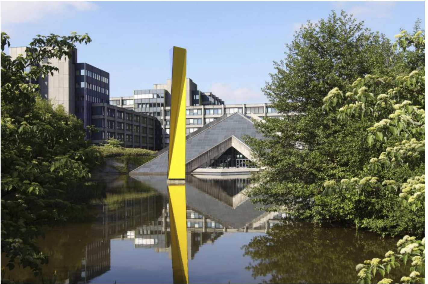
Eberhard Fiebig: Große Wuwa, 1997 / © Eberhard Fiebig; Fotonachweis: Bundeswehr / Jaqueline Faller (2011)

Kunst am Bau im Auftrag des Bundes seit 1950