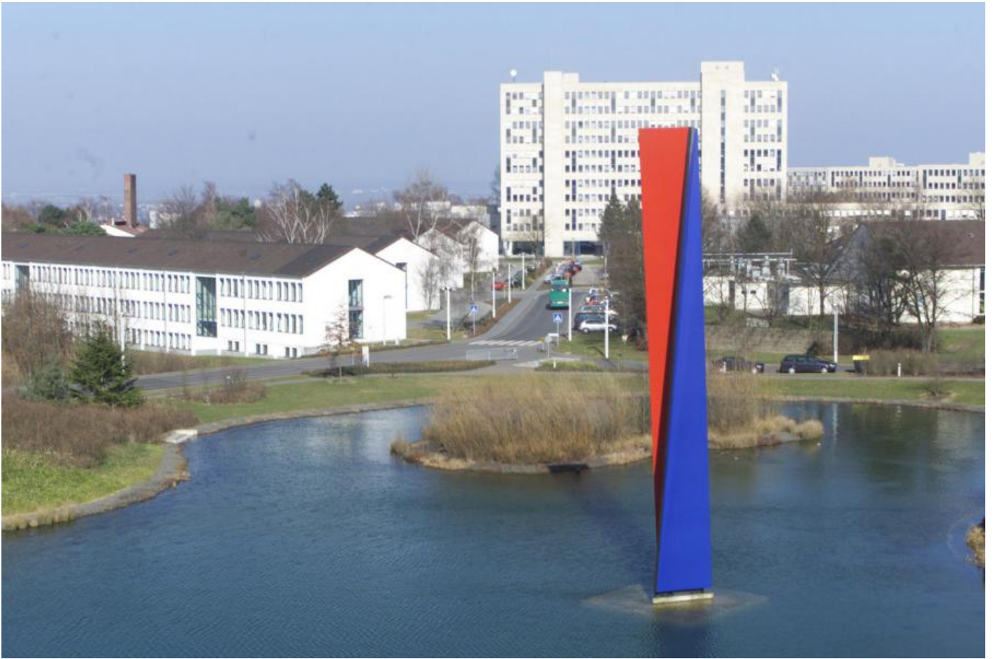
Eberhard Fiebig: Große Wuwa, 1997 / © Eberhard Fiebig

Kunst am Bau im Auftrag des Bundes seit 1950