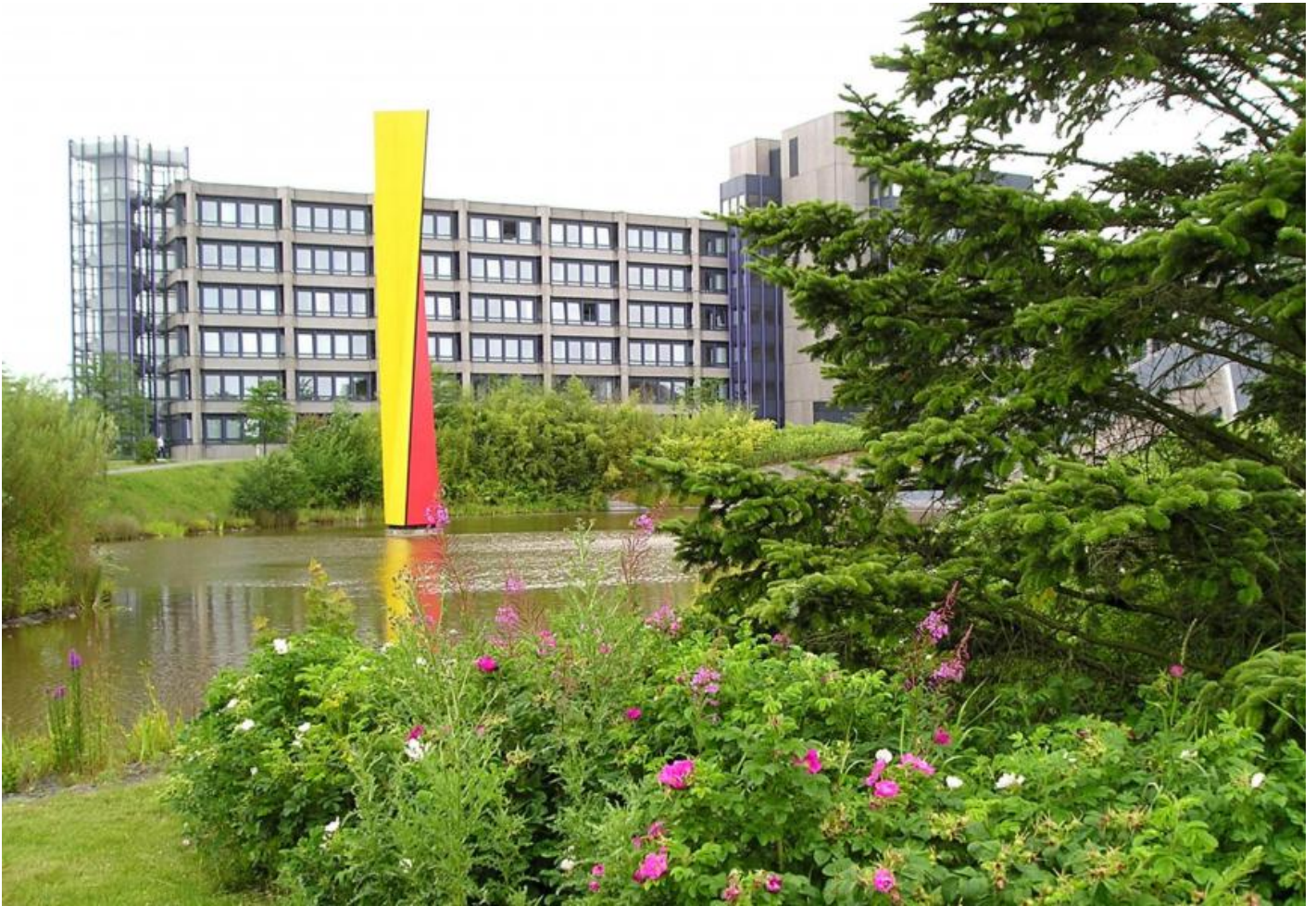
Eberhard Fiebig: Große Wuwa, 1997 / © Eberhard Fiebig; Fotonachweis: Bundeswehr / Klaus Kaumanns (2004)

Kunst am Bau im Auftrag des Bundes seit 1950