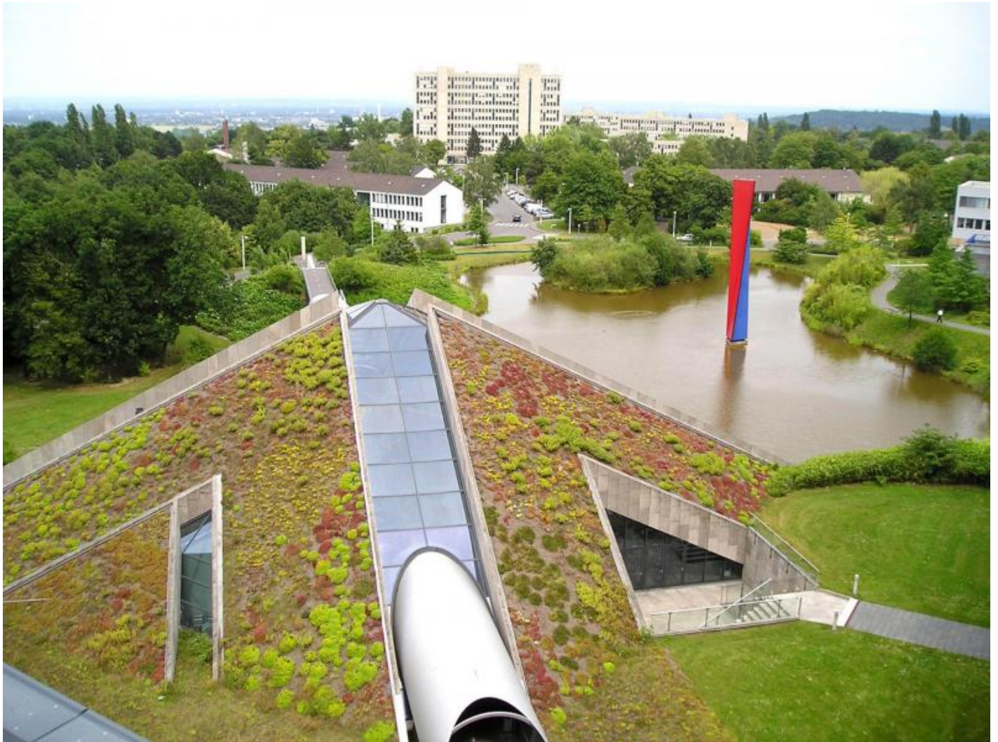
Eberhard Fiebig: Große Wuwa, 1997

Kunst am Bau im Auftrag des Bundes seit 1950