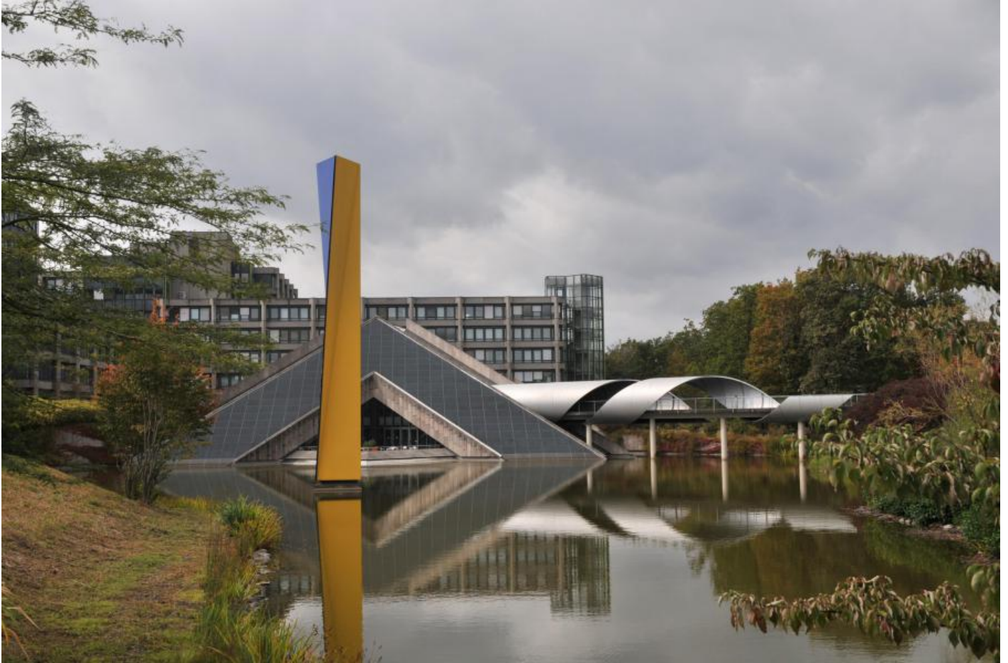
Eberhard Fiebig: Große Wuwa, 1997 / © Eberhard Fiebig