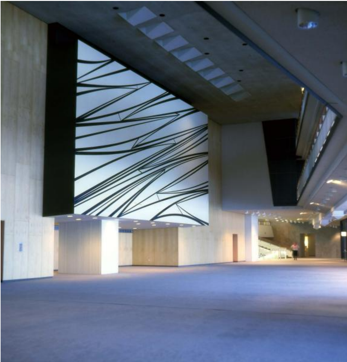
Erich Hauser: Flächenwand, 1977 / © VG Bild-Kunst, Bonn; Fotonachweis: Archiv BBR

Kunst am Bau im Auftrag des Bundes seit 1950