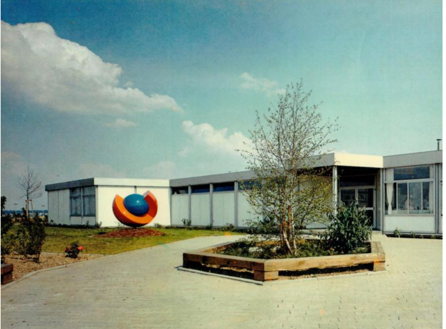
Hans Dieter Bohnet: Farb-Form-Objekt (Wunderapfel/Zauberapfel), 1972