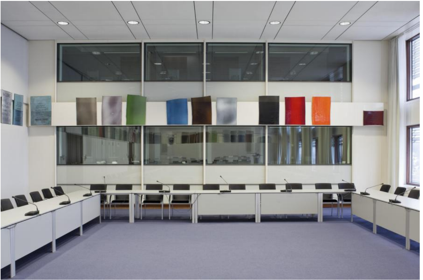
Georg Meistermann: Ehrenchronik demokratischen Verhaltens, 1970 / © VG Bild-Kunst, Bonn; Fotonachweis: BBR / Werner Huthmacher (2011)

Kunst am Bau im Auftrag des Bundes seit 1950