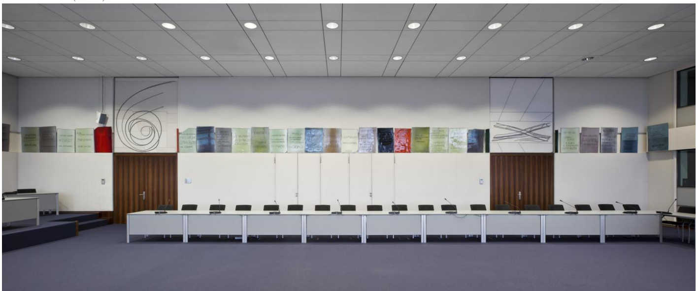
Georg Meistermann: Ehrenchronik demokratischen Verhaltens, 1970 / © VG Bild-Kunst, Bonn; Fotonachweis: BBR / Werner Huthmacher (2011)