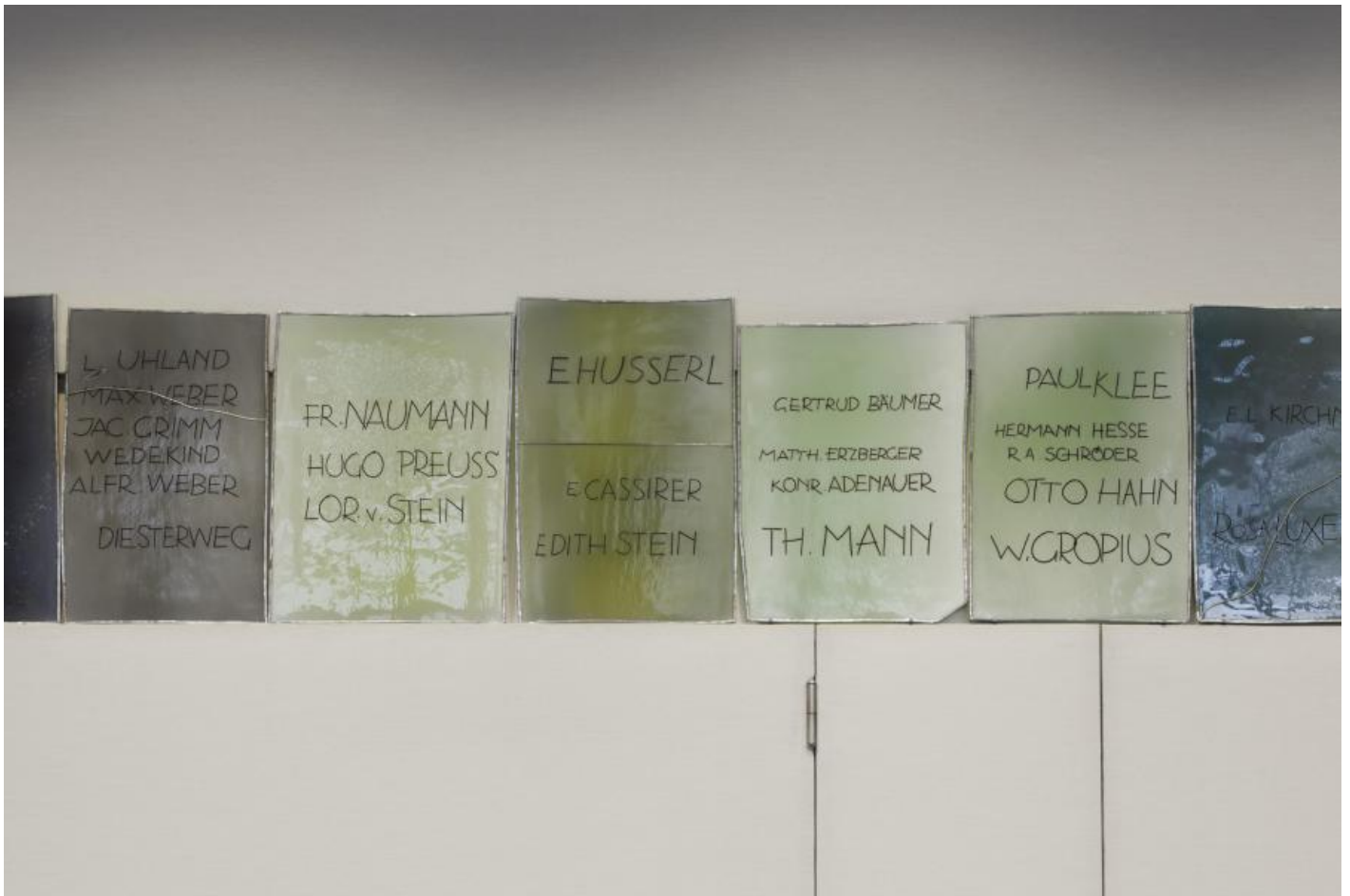
Georg Meistermann: Ehrenchronik demokratischen Verhaltens, 1970 / © VG Bild-Kunst, Bonn; Fotonachweis: BBR / Werner Huthmacher (2011)

Kunst am Bau im Auftrag des Bundes seit 1950