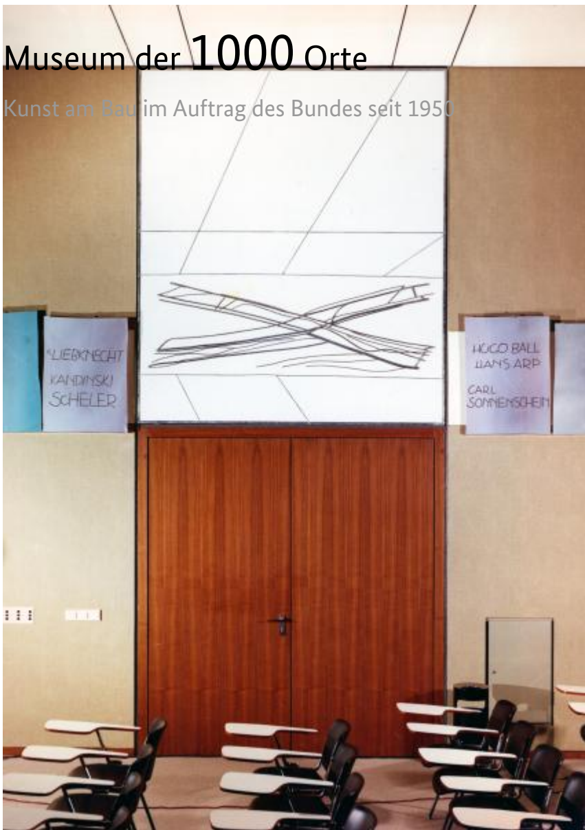
Georg Meistermann: Ehrenchronik demokratischen Verhaltens, 1970 / © VG Bild-Kunst, Bonn; Fotonachweis: BBR Archiv (um 1970)

Kunst am Bau im Auftrag des Bundes seit 1950