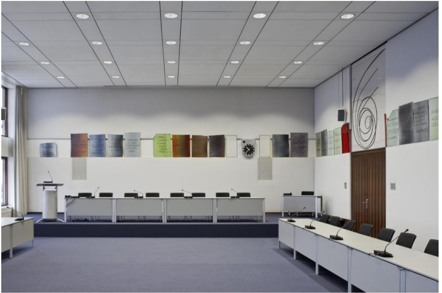
Georg Meistermann: Ehrenchronik demokratischen Verhaltens, 1970 / © VG Bild-Kunst, Bonn

Kunst am Bau im Auftrag des Bundes seit 1950