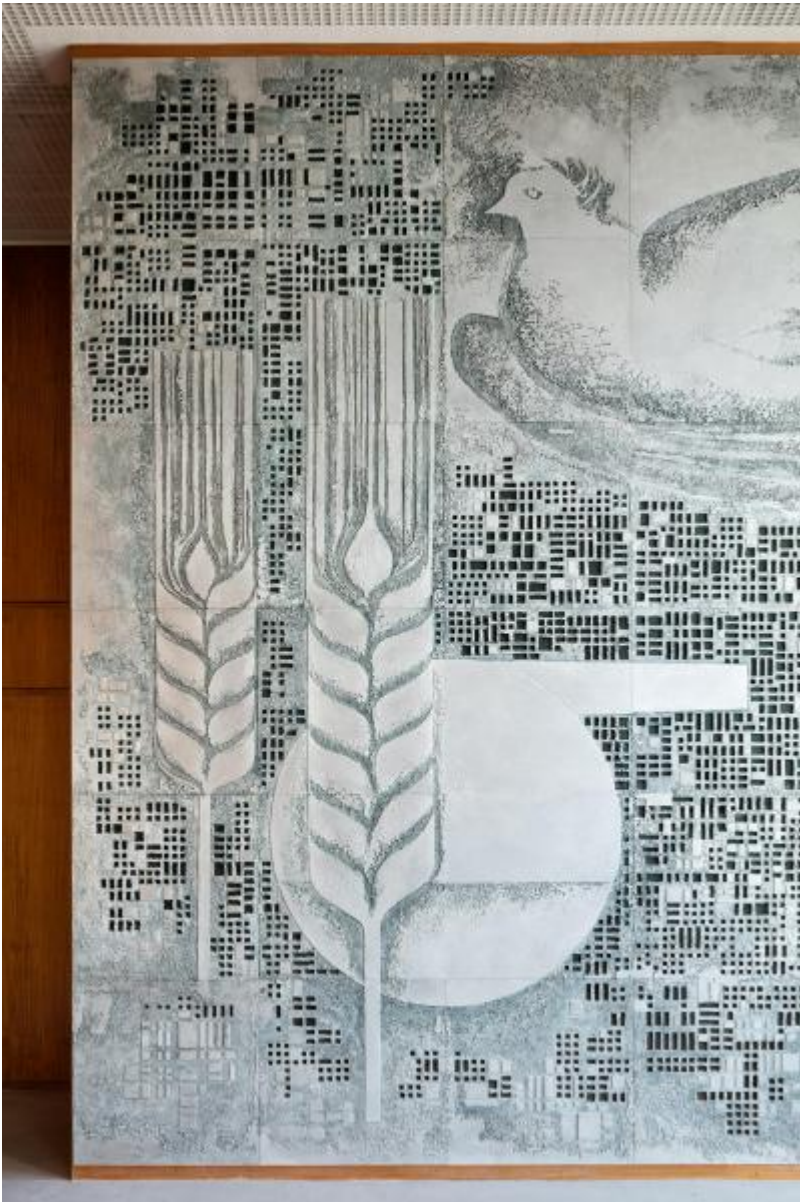
Fritz Kühn: Die Wirtschaft der DDR unter dem Zeichen des Friedens, 1964 / © Fritz Kühn; Fotonachweis: BBR / Cordia Schlegelmilch (2016)

Kunst am Bau im Auftrag des Bundes seit 1950