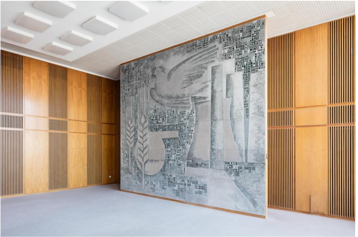
Fritz Kühn: Die Wirtschaft der DDR unter dem Zeichen des Friedens, 1964 / © Fritz Kühn

Kunst am Bau im Auftrag des Bundes seit 1950