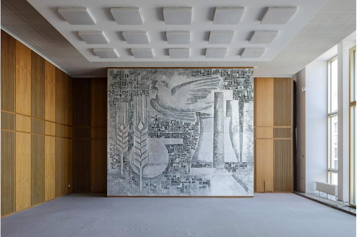
Fritz Kühn: Die Wirtschaft der DDR unter dem Zeichen des Friedens, 1964 / © Fritz Kühn