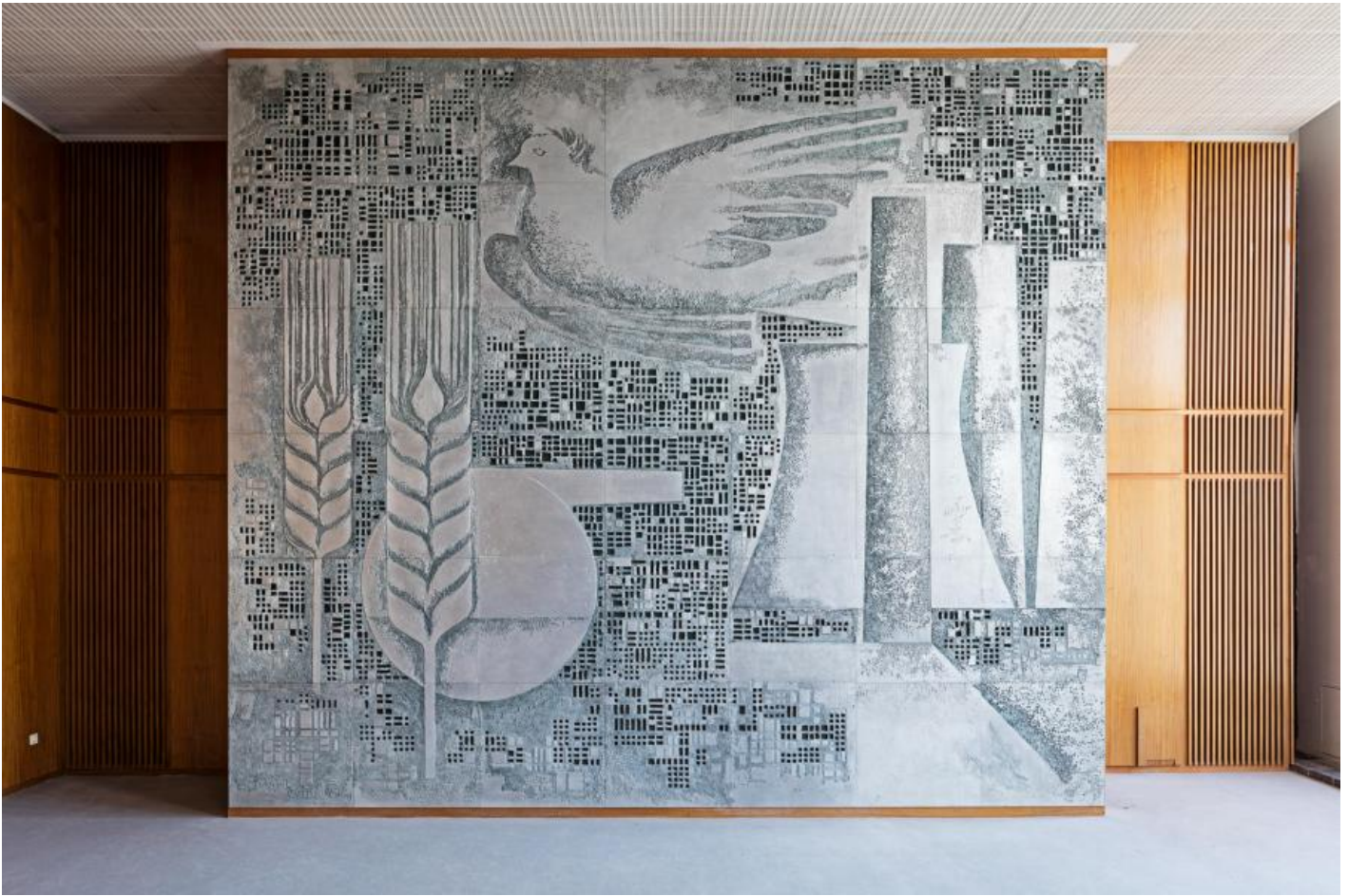
Fritz Kühn: Die Wirtschaft der DDR unter dem Zeichen des Friedens, 1964 / © Fritz Kühn; Fotonachweis: BBR / Cordia Schlegelmilch (2016)

Kunst am Bau im Auftrag des Bundes seit 1950