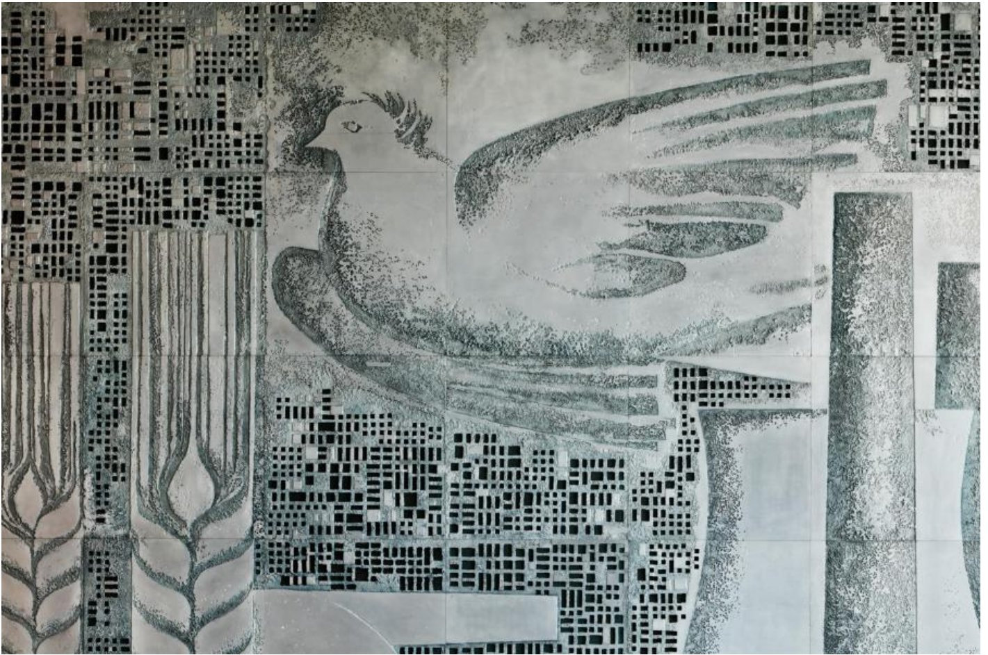
Fritz Kühn: Die Wirtschaft der DDR unter dem Zeichen des Friedens, 1964 / © Fritz Kühn

Kunst am Bau im Auftrag des Bundes seit 1950