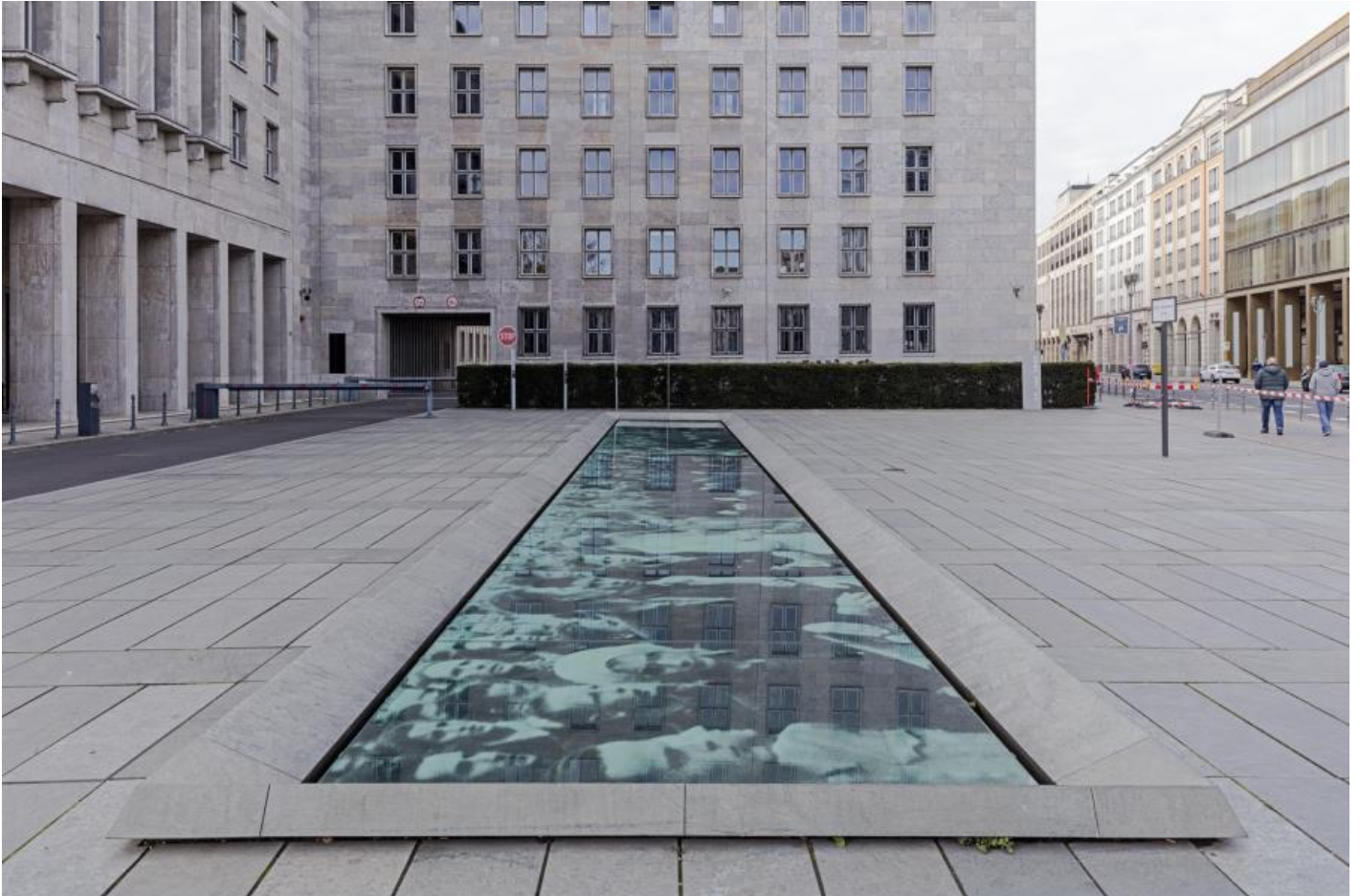
Wolfgang Rüppel: Denkmal zur Erinnerung an den Aufstand des 17. Juni 1953, 2000 / © Wolfgang Rüppel; Fotonachweis: BBR / Cordia Schlegelmilch (2015)