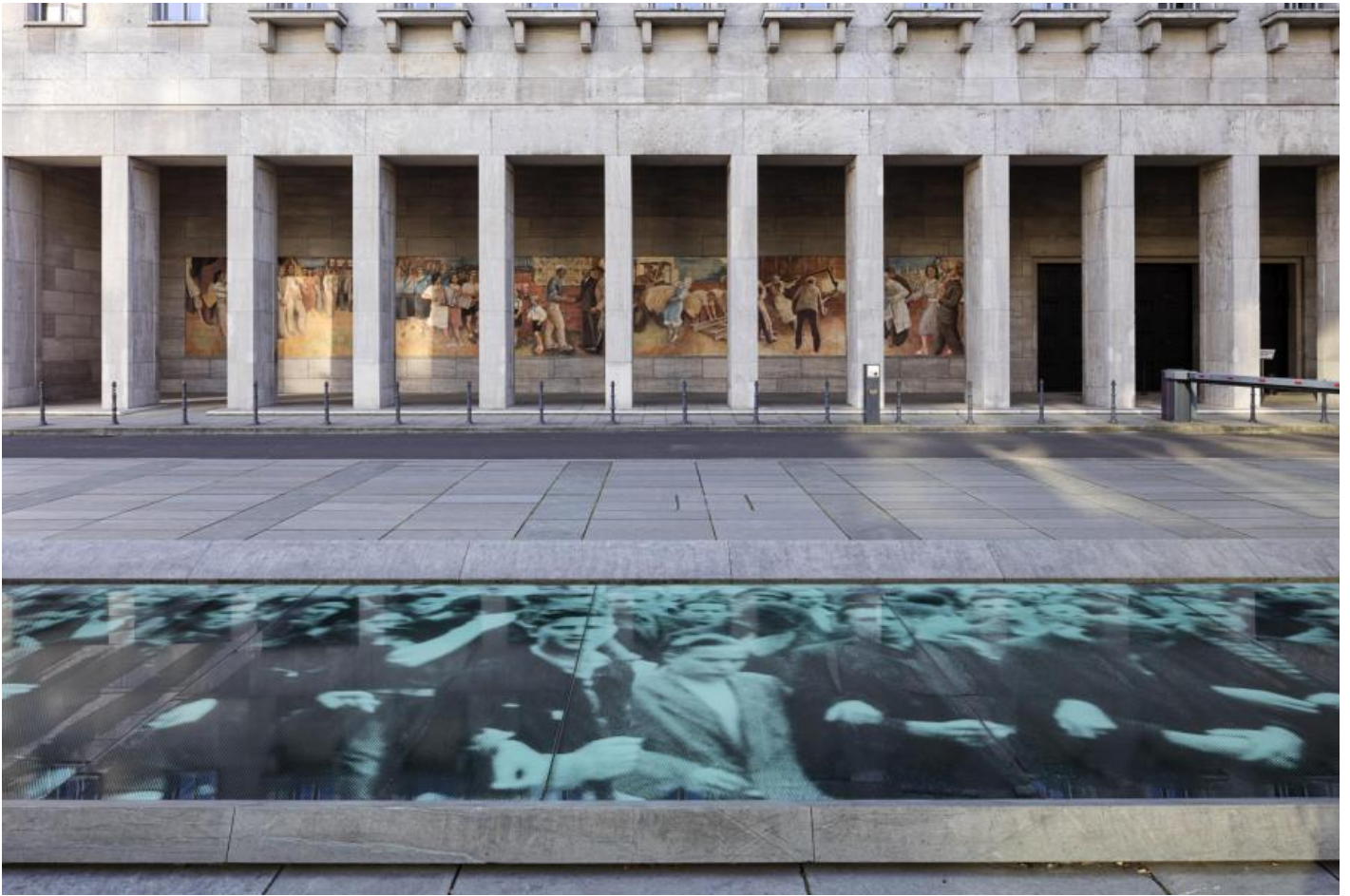
Wolfgang Rüppel: Denkmal zur Erinnerung an den Aufstand des 17. Juni 1953, 2000 / © Wolfgang Rüppel

Kunst am Bau im Auftrag des Bundes seit 1950