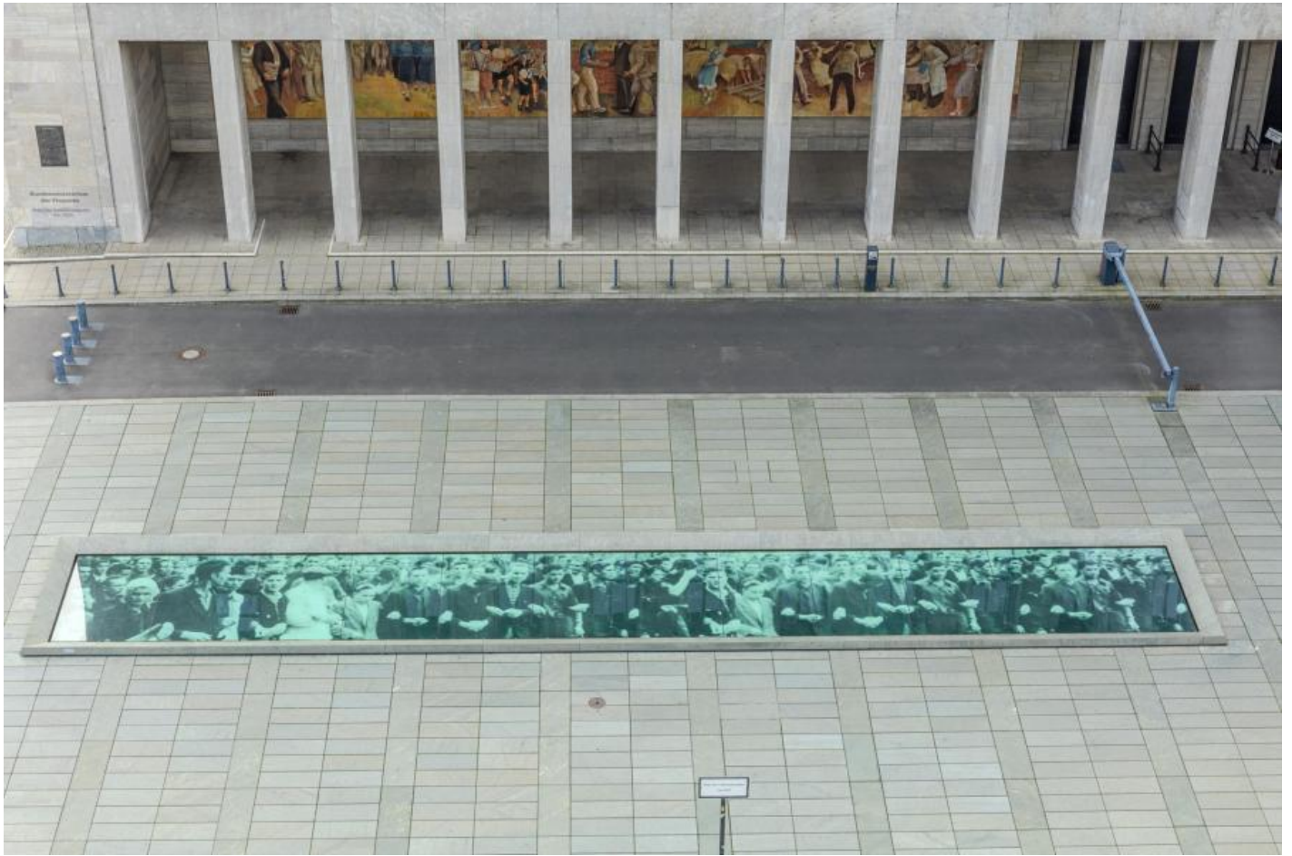
Wolfgang Rüppel: Denkmal zur Erinnerung an den Aufstand des 17. Juni 1953, 2000 / © Wolfgang Rüppel

Kunst am Bau im Auftrag des Bundes seit 1950