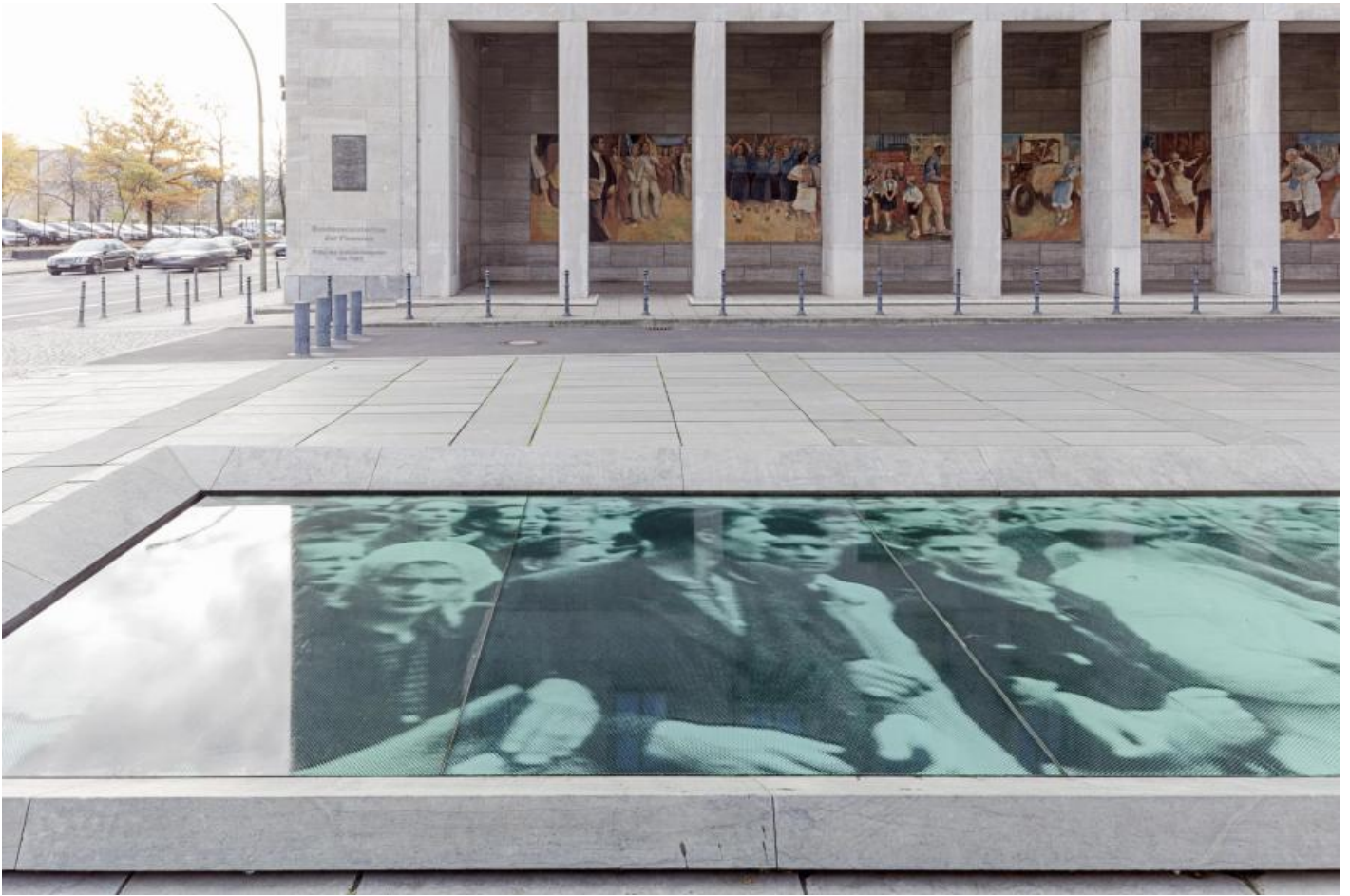
Wolfgang Rüppel: Denkmal zur Erinnerung an den Aufstand des 17. Juni 1953, 2000 / © Wolfgang Rüppel

Kunst am Bau im Auftrag des Bundes seit 1950