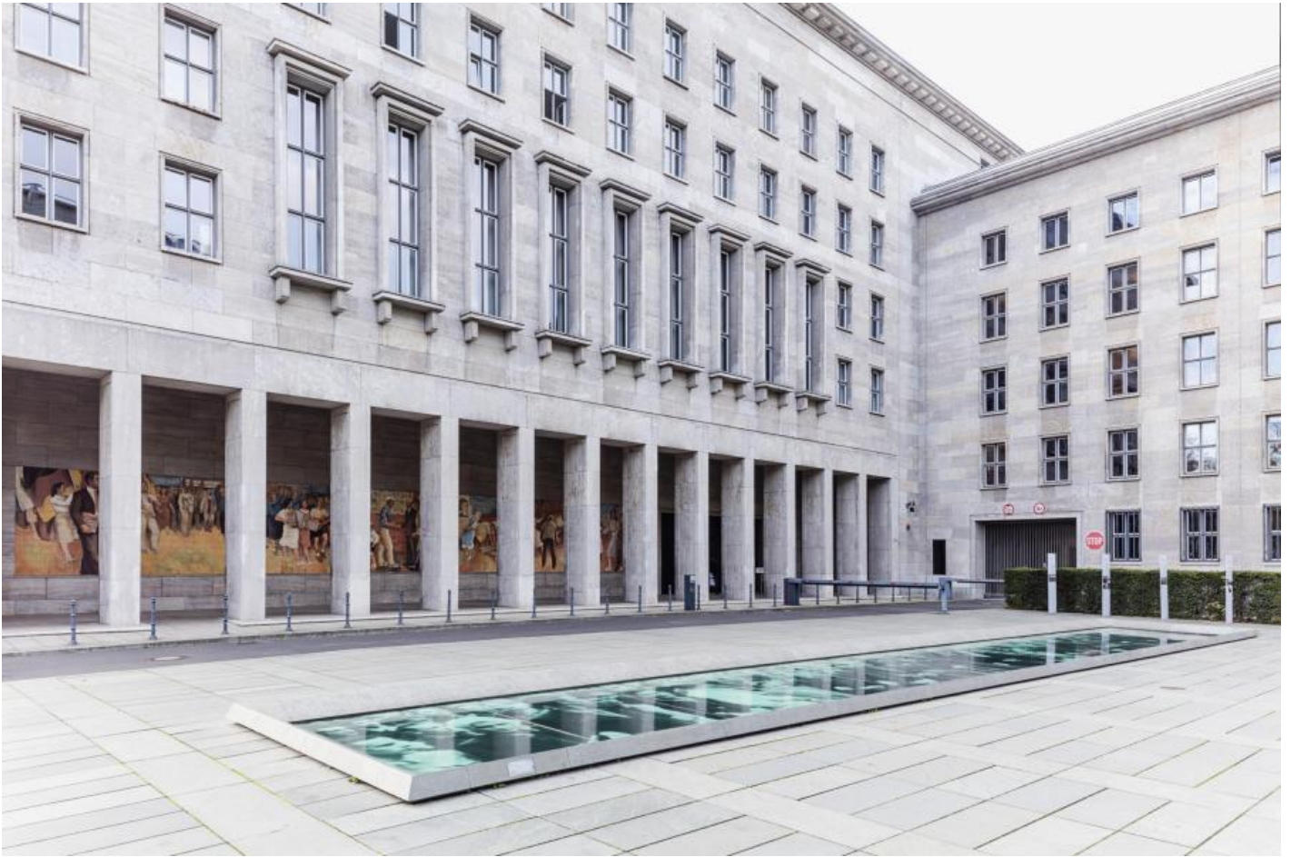
Wolfgang Ruppel: Denkmal zur Erinnerung an den Aufstand des 17. Juni 1953, 2000 / © Wolfgang Ruppel; Fotonachweis: BBR / Cordia Schlegelmilch (2015)

Kunst am Bau im Auftrag des Bundes seit 1950