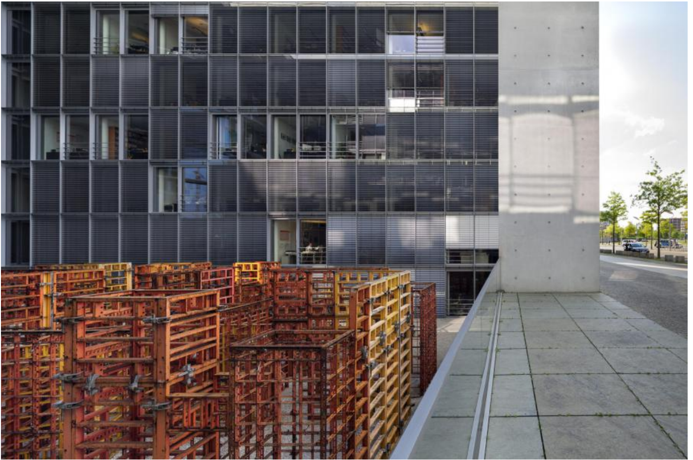
Franka Hörschemeyer: BFD - bündig fluchtend dicht (Raumlabyrinth), 2001 / © VG Bild-Kunst, Bonn; Fotonachweis: DBT / Jörg F. Müller (2014)

Kunst am Bau im Auftrag des Bundes seit 1950