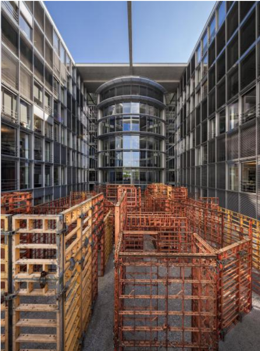
Franka Hörschemeyer: BFD - bündig fluchtend dicht (Raumlabyrinth), 2001 / © VG Bild-Kunst, Bonn; Fotonachweis: DBT / Jörg F. Müller (2014)

Kunst am Bau im Auftrag des Bundes seit 1950