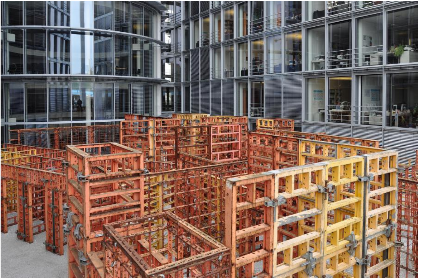
Franka Hörnschemeyer: BFD - bündig fluchtend dicht (Raumlabyrinth), 2001 / © VG Bild-Kunst, Bonn; Fotonachweis: BBR / Marnie Schäfer (2013)

Kunst am Bau im Auftrag des Bundes seit 1950