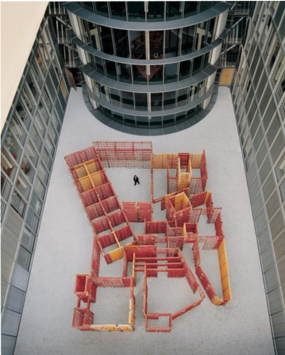
Franka Hörnschemeyer: BFD - bündig fluchtend dicht (Raumlabyrinth), 2001 / © VG Bild-Kunst, Bonn; Fotonachweis: DBT / Stephan Erfurt (2001)

Kunst am Bau im Auftrag des Bundes seit 1950