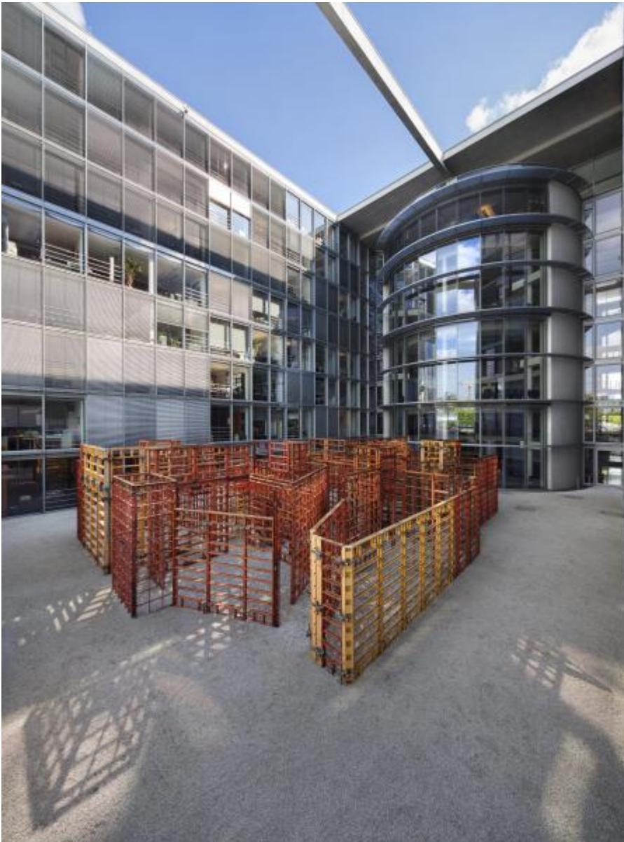
Franka Hörnschemeyer: BFD - bündig fluchtend dicht (Raumlabyrinth), 2001 / © VG Bild-Kunst, Bonn

Kunst am Bau im Auftrag des Bundes seit 1950