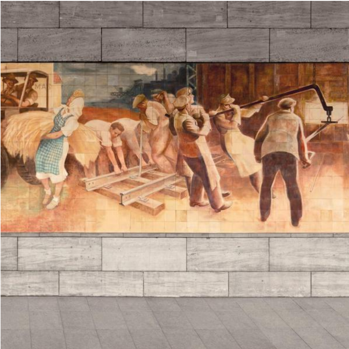
Max Lingner: Aufbau der Republik, 1953 / © VG Bild-Kunst, Bonn; Fotonachweis: BBR / Cordia Schlegelmilch (2016)

Kunst am Bau im Auftrag des Bundes seit 1950