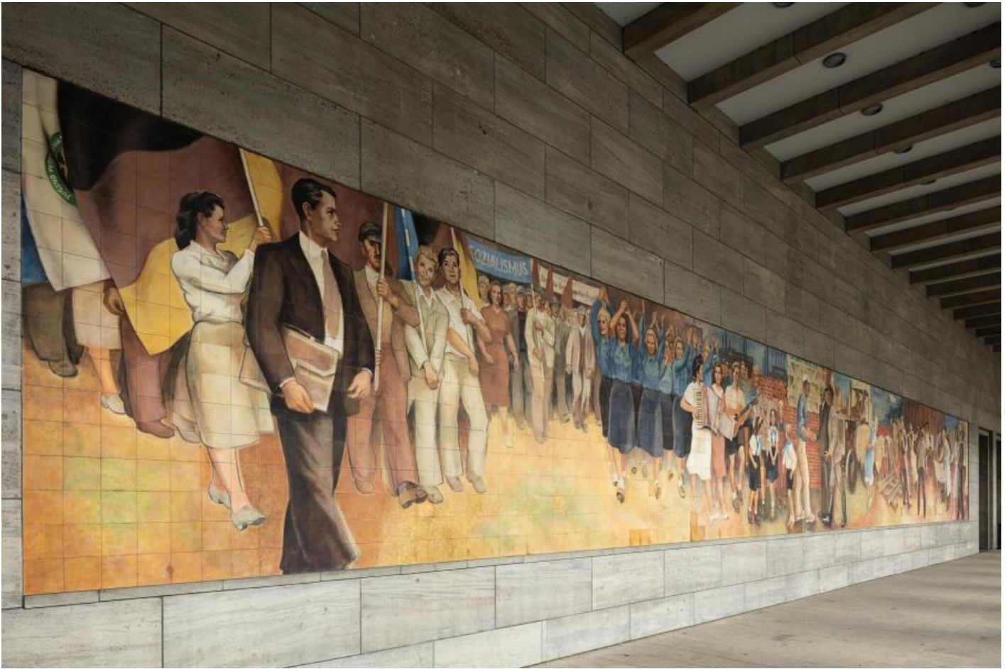
Max Lingner: Aufbau der Republik, 1953 / © VG Bild-Kunst, Bonn; Fotonachweis: BBR / Cordia Schlegelmilch (2016)

Kunst am Bau im Auftrag des Bundes seit 1950