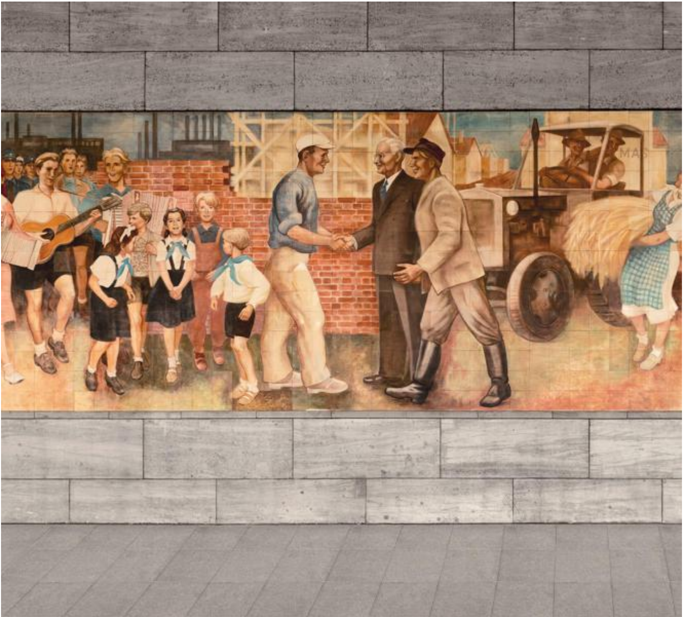
Max Lingner: Aufbau der Republik, 1953 / © VG Bild-Kunst, Bonn; Fotonachweis: BBR / Cordia Schlegelmilch (2016)

Kunst am Bau im Auftrag des Bundes seit 1950