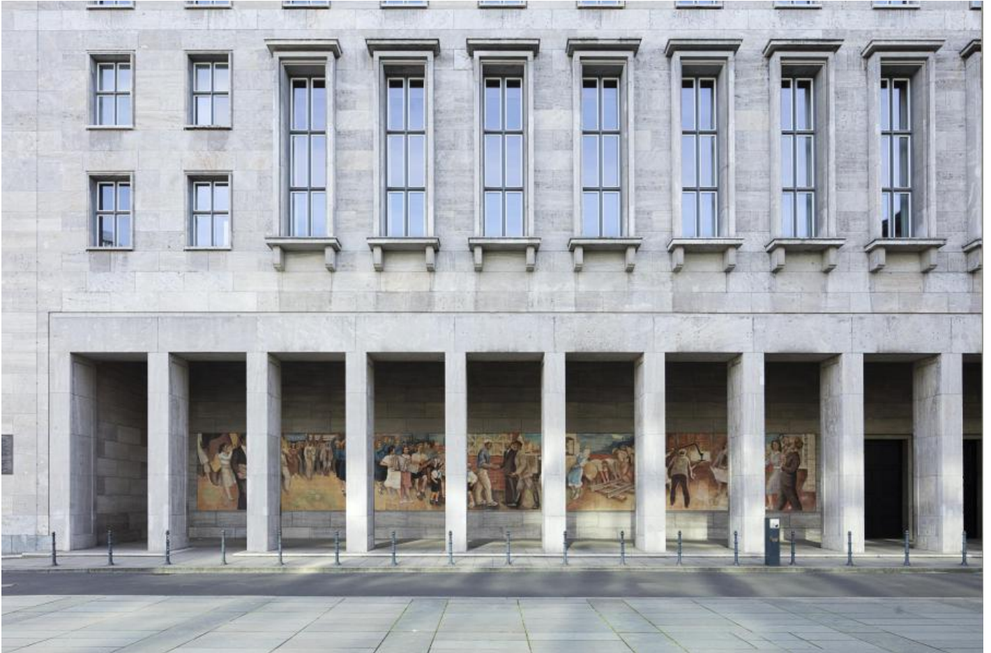
Max Lingner: Aufbau der Republik, 1953 / © VG Bild-Kunst, Bonn; Fotonachweis: BBR / Cordia Schlegelmilch (2016)