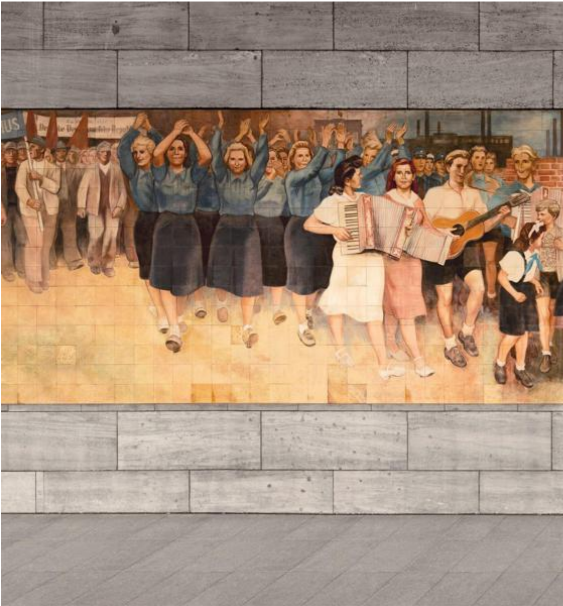
Max Lingner: Aufbau der Republik, 1953 / © VG Bild-Kunst, Bonn; Fotonachweis: BBR / Cordia Schlegelmilch (2016)

Kunst am Bau im Auftrag des Bundes seit 1950