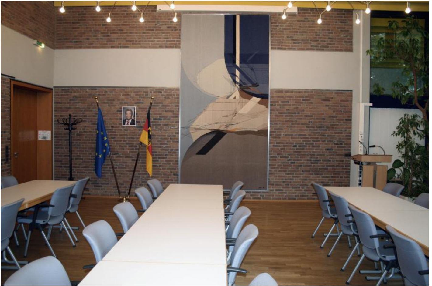
Gabriele Grosse: Archnura Celeste, 1979 / © VG Bild-Kunst, Bonn

Kunst am Bau im Auftrag des Bundes seit 1950