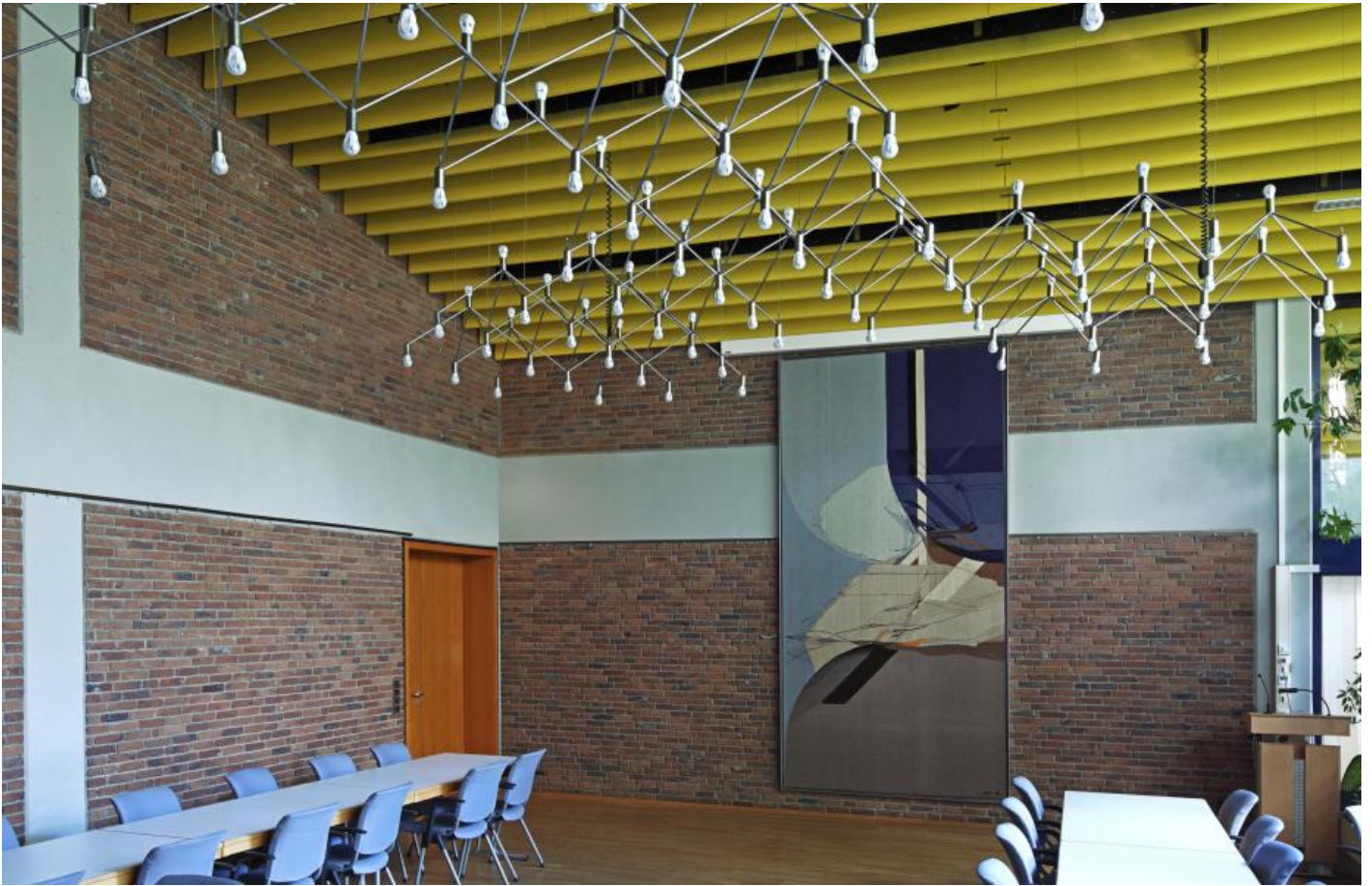
Gabriele Grosse: Arachnura Celeste, 1979 / © VG Bild-Kunst, Bonn

Kunst am Bau im Auftrag des Bundes seit 1950