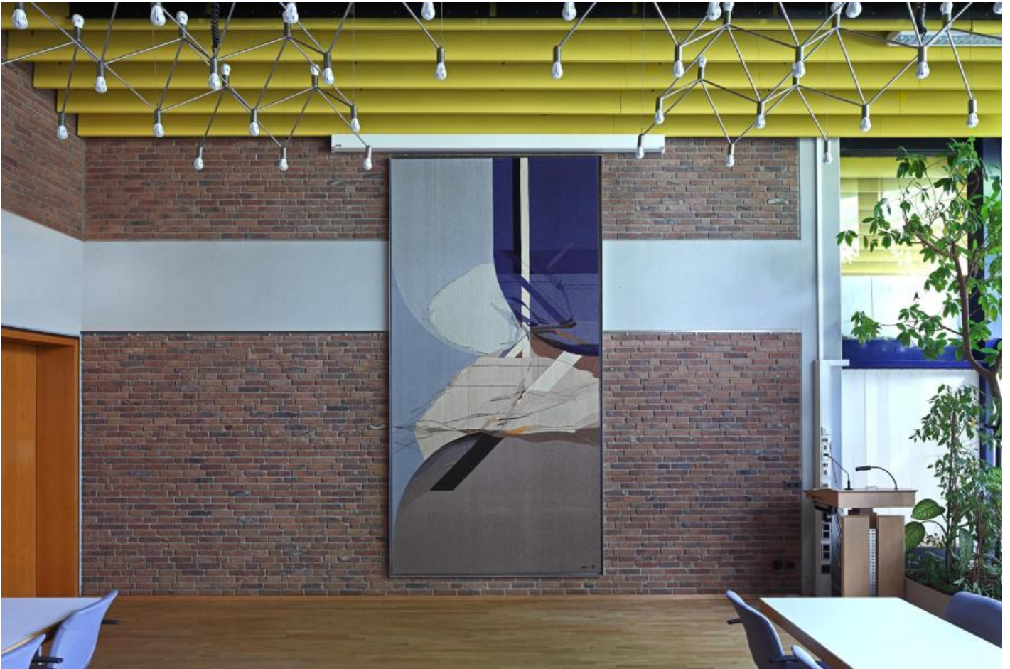
Gabriele Grosse: Archnura Celeste, 1979 / © VG Bild-Kunst, Bonn

Kunst am Bau im Auftrag des Bundes seit 1950