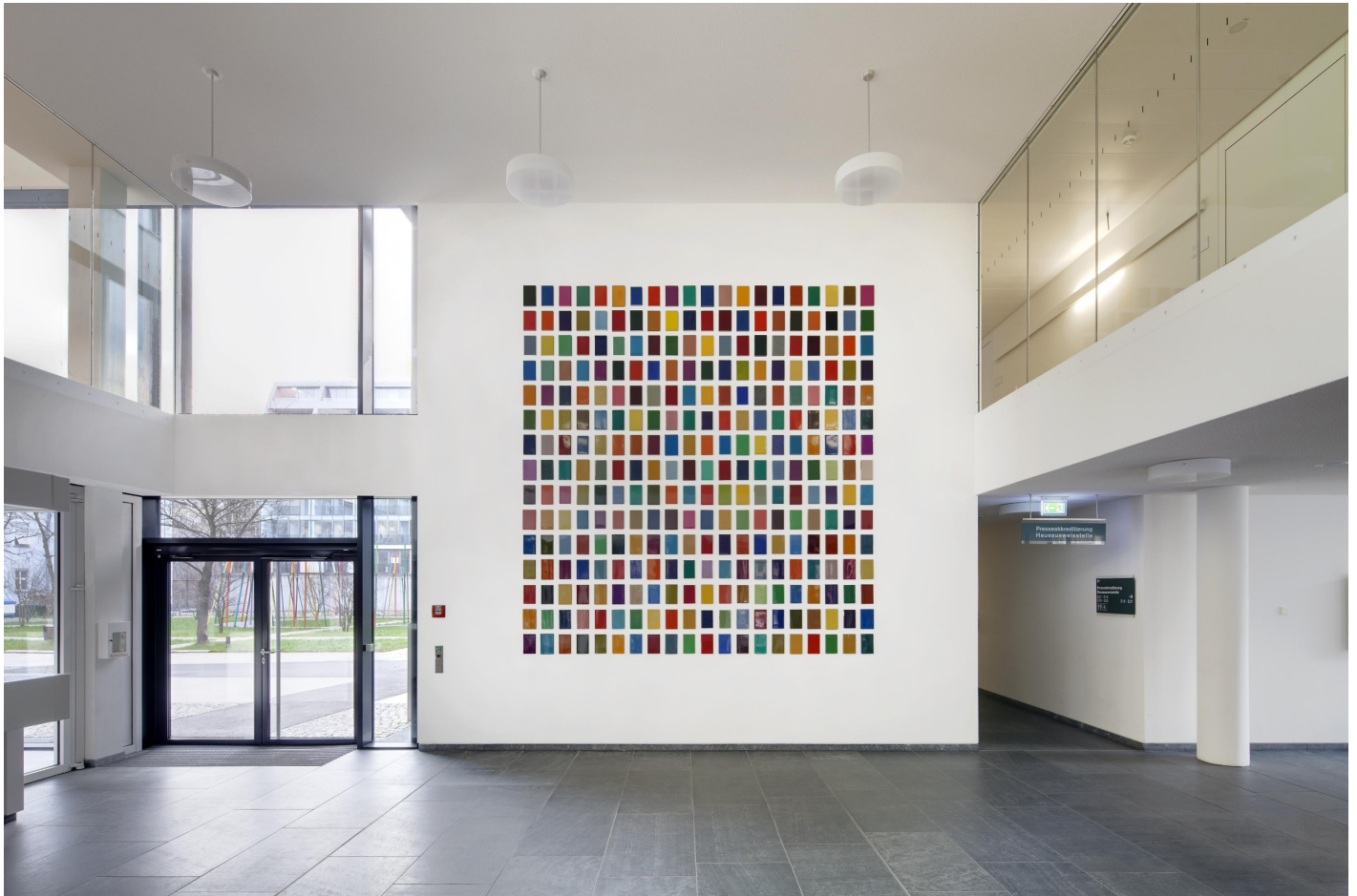
Peter Wüthrich: 600 Bücher für 600 ParlamentarierInnen, 2012 / © Peter Wüthrich