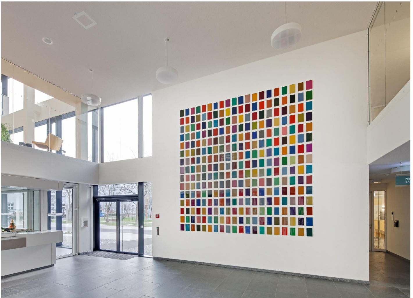
Peter Wüthrich: 600 Bücher für 600 ParlamentarierInnen, 2012 / © Peter Wüthrich; Fotonachweis: BBR / Cordia Schlegelmilch (2013)

Kunst am Bau im Auftrag des Bundes seit 1950